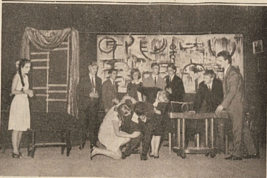
Cankarjeva drama «Jakob Ruda» v izvedbi gojencev Državnega znanstvenega liceja v Trstu