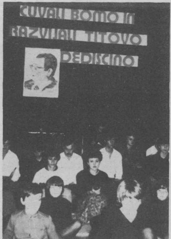
Literarni večer Titove mlade generacije v Dolskem