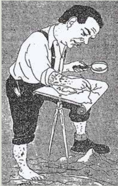
Slika 3: Selan se pripravljala na kartografsko-monetarne podvige. Avtor risbe ni znan, je pa poskenirana iz Žerovnikove knjige (2012, str. 156).

Sama po sebi se ponuja vzporednica med Selanom in Škotinjo Mary F. Somerville iz predhodnega poglavja. Če so njo zaradi zaslug za znanost natisnili na škotskem bankovcu za 10 funtov, si je Kranjec Selan bankovce ukrojil po svoji meri in potrebi. Ne sicer funtov, ker je bil skromen, se je zadovoljil z dinarji. Somervilleovo je stroka postavila na denar, Selanu