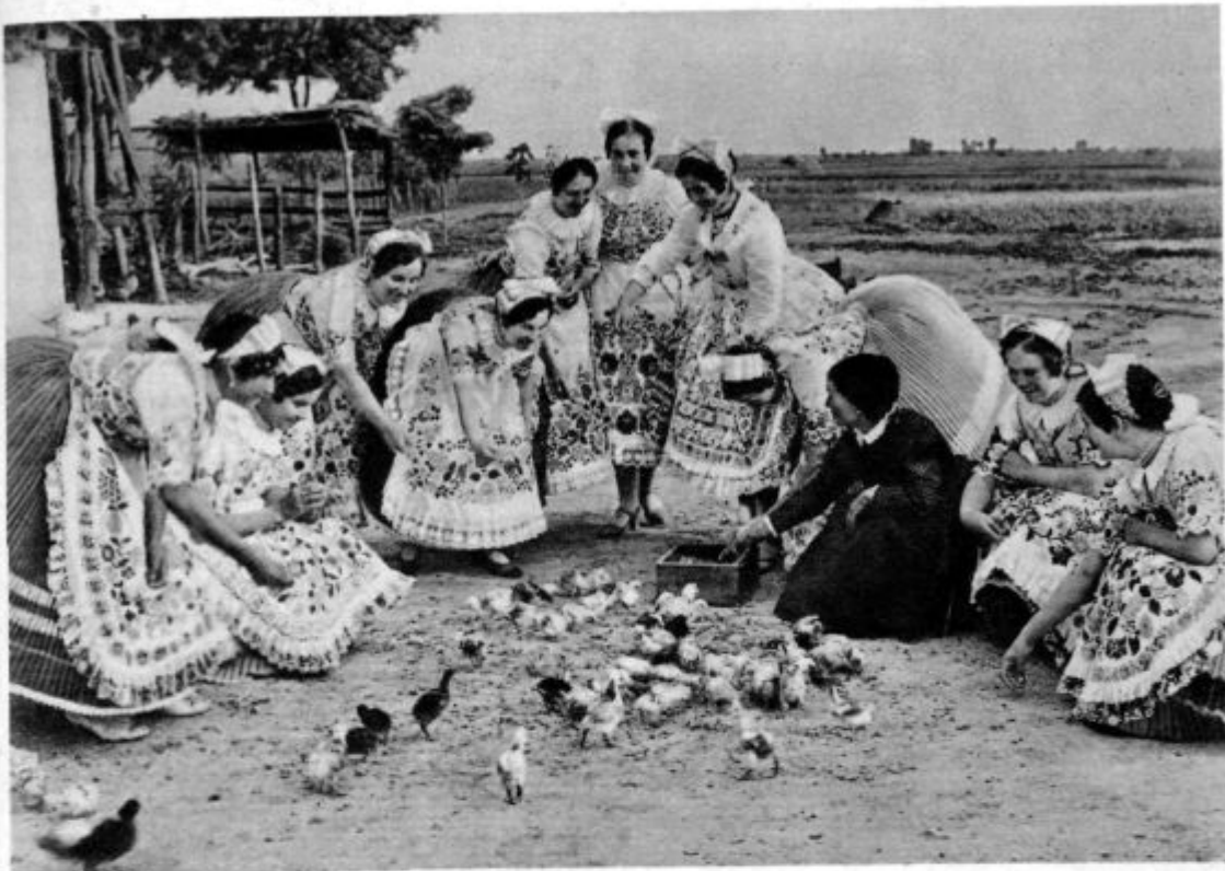
Pred veliko nočjo Narodni običaji in narodne noše na Ogrskem