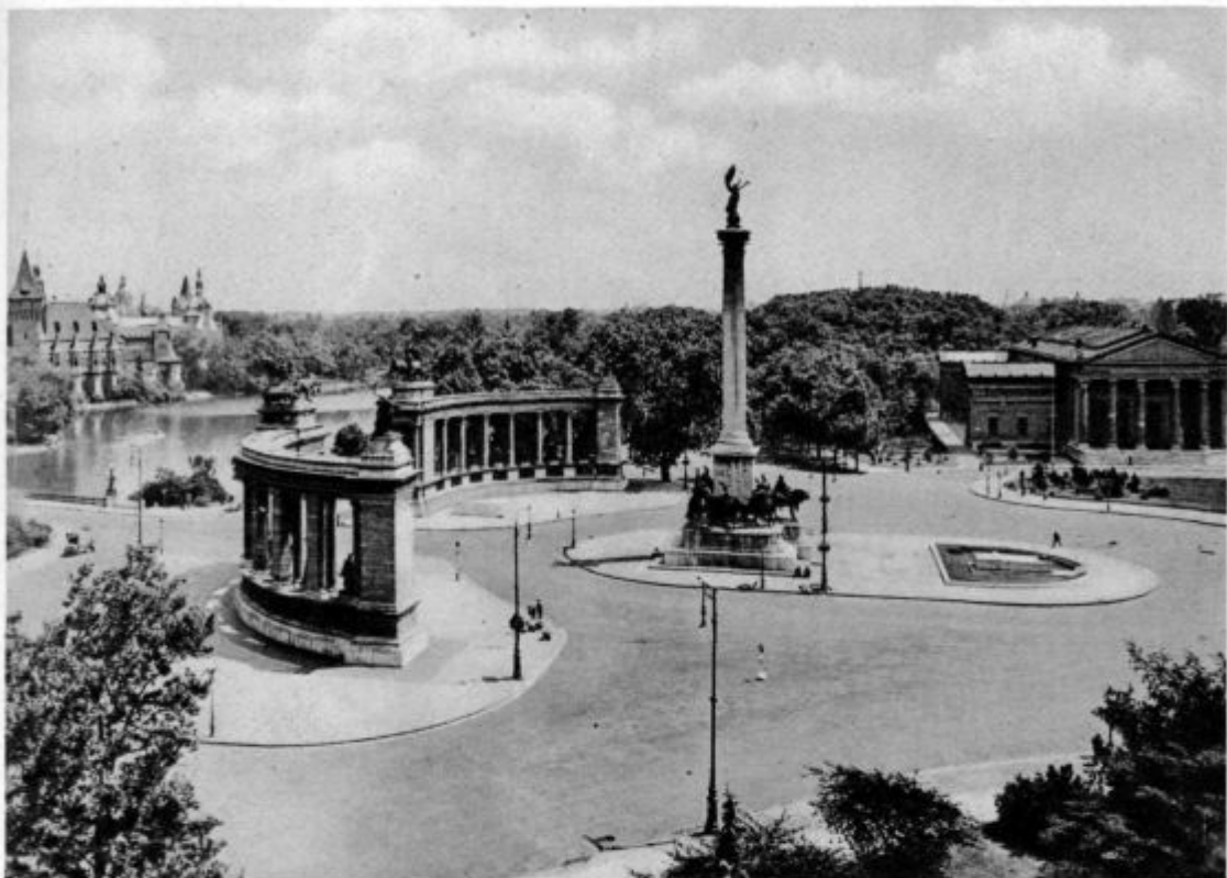
Trg junakov v Budimpešti Središče Evh. kongresa (Trg glavnih zborovanj)

kamenja in spet peska, dokler ni nastal velik kup. Potem se je počasi ogledoval okrog in okrog in poslušal. Najgloblja tišina vse naokrog. Le droben kuščar se je sončil na zidu in je kot zaklet dvigal glavo. Sicer pa nikjer nikogar, ničesar, samo gluha tišina.