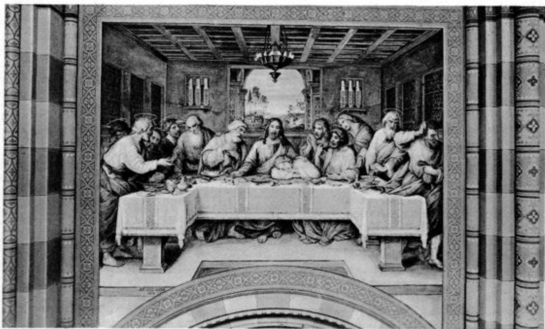
Stolnica v Djakovem