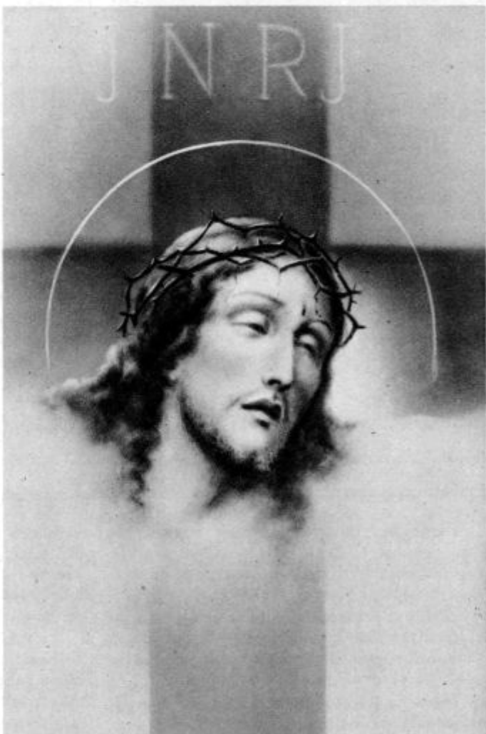
„Oče, v Tvoje roke izročim svojo dušo.“ (Lk 23, 46.)