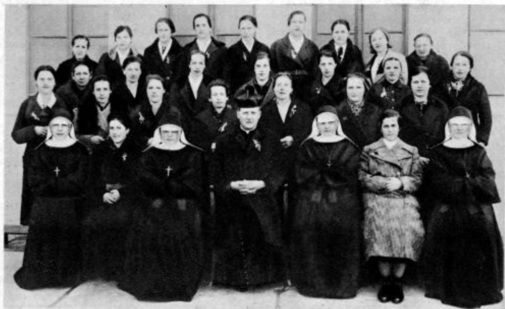
Udeleženke duhovnih vaj na Mali Loki pri Ihanu

Človek premišljuje, kakšna bo sodba onih rabeljskih Neronov, ki so zadnjih 20 let iz-