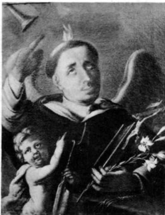
Sv. Vincencij Fererski