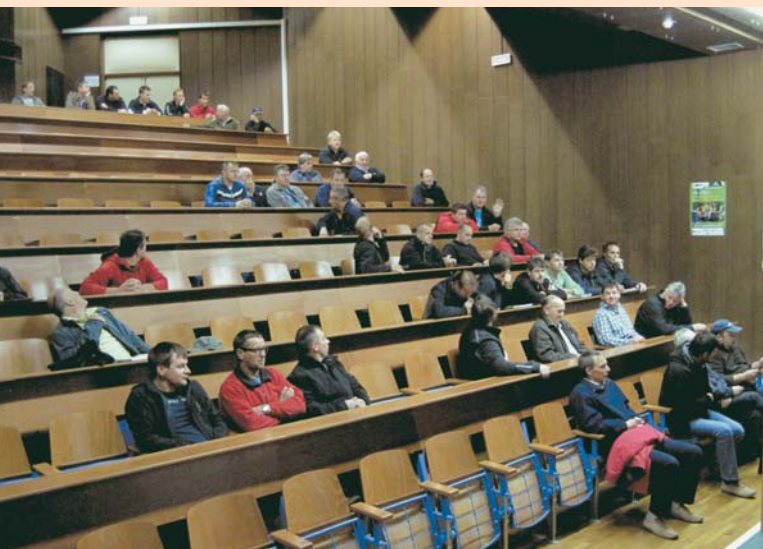
Autoprevozniki na obveznem periodičnem izobraževanju

Območna obrtno-podjetniška zbornica Postojna je v soboto, 25. maja organizirala redno usposabljanje voznikov po programu za leto 2013. Predavanje je bilo namenjeno tako voznikom za prevoz blaga kot voznikom za prevoz potnikov.