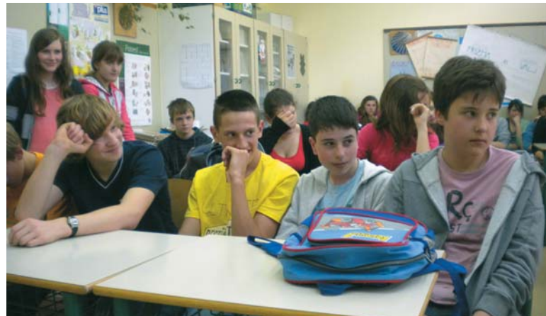
Sicer resnobni obrazi učencev so se ob zanimivih predstavbah poklicev tudi sprotili

Za uvod v poklicno usmeritev bodočih srednješolcev in s ciljem, da bi bila odločitev kam po osnovni šoli, čim lažja, je na OŠ Cerknica 21. Maja potekal tehniški dan na to temo za vse učence osmih razredov. V predstavitvi