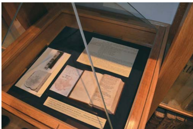
Dragoceni primerek Boboričeve slovnice 1584

Kralj Karel X. in njegova družina so bili namreč v času francoske revolucije pregnani iz Francije. Samostan se lahko pohvali s knjižnico, ki ima preko 16.500 knjig. Za za Slovence je med njimi najpomembnejša slovnica Adama Bohoriča – Zimske urice iz leta 1584. Iz zgodovine v realnost so nas popeljale čudovite vonjave vrtnic burbonk, ki krasijo samostanski vrt in so v času našega obiska bujno cvetele.