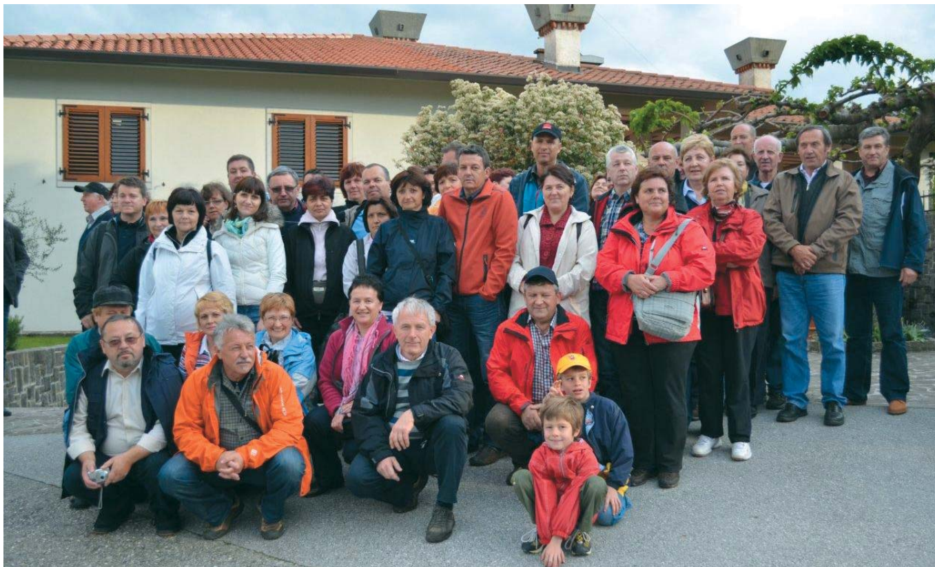
Dobro razpoloženi izletniki

Pot smo nadaljevali proti Novi Gorici oz. samostanu Kostanjevica, v katerem domujejo frančiškani. Na Kostanjevici je božjepotno svetišče, pestre zgodovine, ki danes predstavlja oazo zelenja in miru za bližnje prebivalce Nove Gorice in Gorice. Hkrati je tudi zgodovinski spomenik, saj v sarkofagih grobnice počivajo zadnji člani francoske kraljeve rodbine Bourbonov.