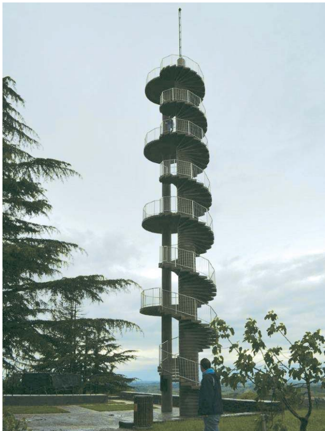
Stolp v Gojačab se pne visoko proti nebu

Kralj Karel X. in njegova družina so bili namreč v času francoske revolucije pregnani iz Francije. Samostan se lahko pohvali s knjižnico, ki ima preko 16.500 knjig. Za za Slovence je med njimi najpomembnejša slovnica Adama Bohoriča – Zimske urice iz leta 1584. Iz zgodovine v realnost so nas popeljale čudovite vonjave vrtnic burbonk, ki krasijo samostanski vrt in so v času našega obiska bujno cvetele.