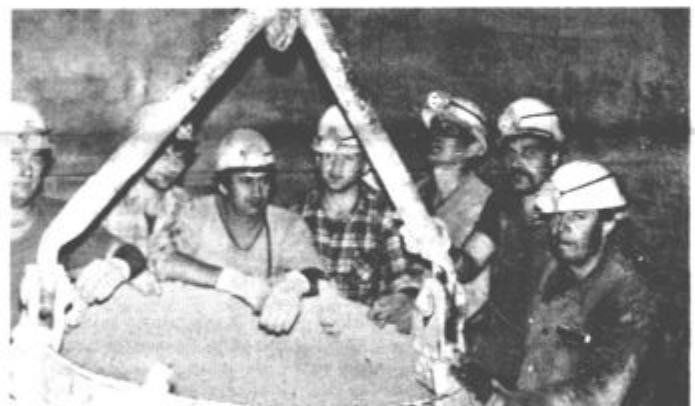
Ena od ekip, ki dela na globljenju jaška Šoštanj, zbrana okoli vedra ali »kible«, ki služi za prevoz materiala in ljudi. V takšni smo se tudi mi spustili v ponedeljek 224 metrov globoko.