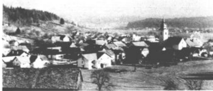
Zasluzeno priznanje je predvsem spodbuda in obveza za Rečico in njene prebivalce

Če ste eden teh, pokličite na Občinski sindikalni svet Velenje, kjer bodo v primeru, da bo zanimanja dovolj, z izvajalci del navezali stike in projekt predstavili tudi tukaj.