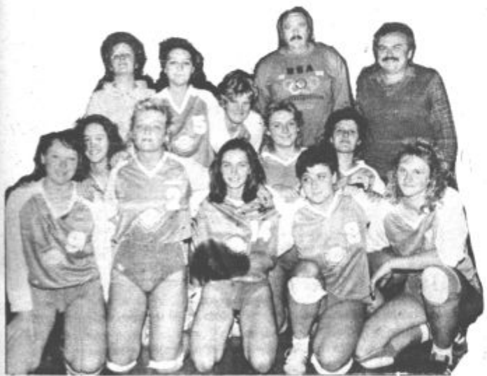
Zadovoljme z dosedanjo igro

Z dobro in organizirano igro so gostje zlahka premagale oslabljene domačinke s 3:0 (9, 1, 11). S to zmago so se povzpele na drugo mesto na lestvici, uspešne nastope pa bodo skušale nadaljevati v naslednjem kolu, ko se bodo doma pomerile z ekipo Ljubno GLIN.