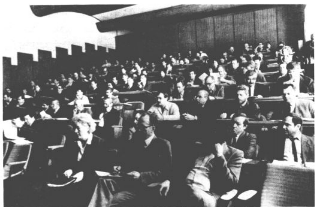
Na konferenci OK ZKS Velenje so namenili veliko pozornosti prenovi te organizacije

Ocenjeno je bilo, da je Zveza komunistov mnogo premalo časa in pozornosti namenjala notranji organiziranosti, zato pa bi sedaj morali biti koraki skrbno premiš-