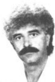
Piše: VINKO VASLE

Najprej je nekje na jugu postal kandidat za državni praznik 1. december, kot spomin na dan ko je bila leta 1918 ustanovljena kraljevina SHS. Ta dan bi po prepričanju marsikoga morali »praznovati« kot opomin na to, kam nas lahko pripeljeta unitarizem in kralji, ki se vsilijo narodom, ne pa da bi iz njega delali nove bakanalije. Predlog je — razen v Srbiji in Črni Gori — gladko propadel, kar so nekateri razglasili za ponoven napad na Jugoslavijo, ki je — trdijo — vendarle nastala pred dobrimi sedemdesetimi leti. Nam so pa v šolah vbijali v glave, da se je vsa naša zgodovina začela leta 1941, marsikje pa končala 1945. leta, kot kažejo aktualni politično-gospodarski dogodki. Potem so se za kandidate za pripravo mitinga sredi Ljubljane prijaviteli tovariši iz srbskega odbora za vrnitev Srbov in Črnogorcev na Kosovo, ki bi se zelo radi »skupaj s slovenskim narodom spomnili na usodne zgodovinske trenutke iz preteklosti obeh narodov in tako spremenili izjemno grdo sedanost«.