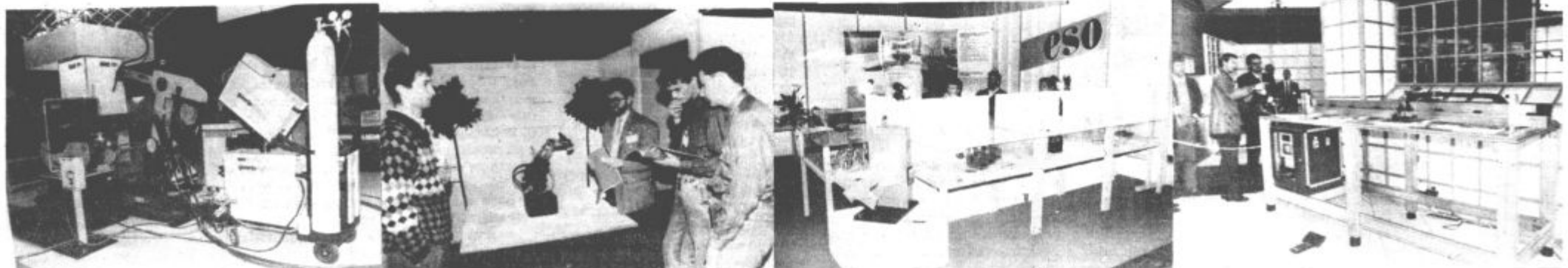
Ena zadnjih novosti v ponudbi Gorenja Procesna oprema je strežna naprava, ki je tokrat priključena na prenosni industrijski terminal

ben inovacijski paviljon, v katerem so se na skupnem prostoru predstavili jugoslovanski inštituti in univerze. Med razstavljalci v tem inovacijskem paviljonu je bil tudi naš Center srednjih šol tehnične in družboslovne usmeritve. Predstavili so didaktični robot JUPET 3, namenjen učenju osnov dela z roboti in robotskimi delovnimi celicami. Programska oprema robota JUPET 3 omogoča enostaven nadzor tega petstopenjskega robota s pnevmatskim prijemalom, ki ga poganja pet enosmernih motorjev prek ustreznih reduktorjev. Že v kratkem bo na voljo za robot JUPET 3 tudi poseben programski jezik JUPET.