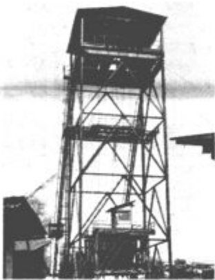
Jašek na površju.