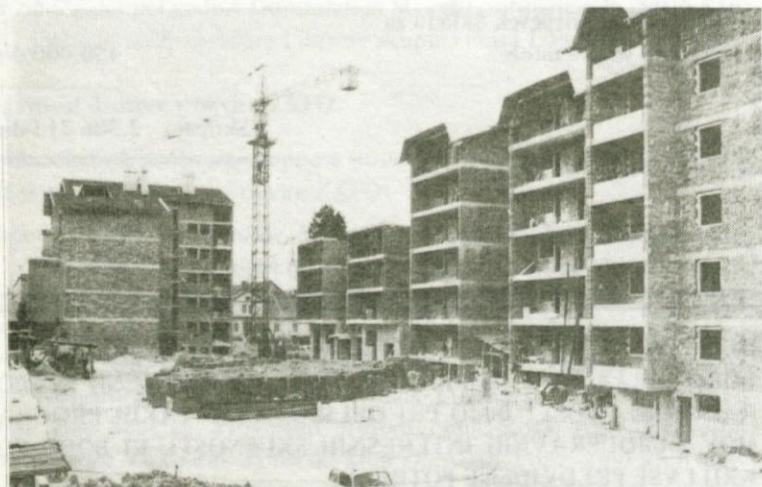
Iz solidarnostnih sredstev zgrajena stanovanja za delavce