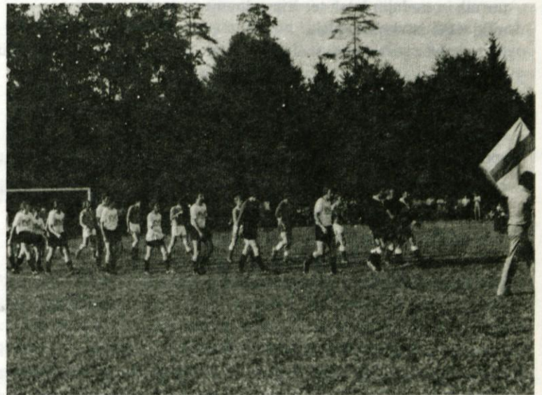
Nogometna sindikalna prvenstva ne pomenijo samo tekmovalca, ampak tudi rekreacijo za mnoge delovne ljudi

Iz tega kratkega poročila je razvidno, da so telesna kulturna skupnost in njeni organi ter organizacije v letošnjem letu aktivno delali ter izpolnili postavljeni program. Za izvedbo tega programa so porabili planirana sredstva.