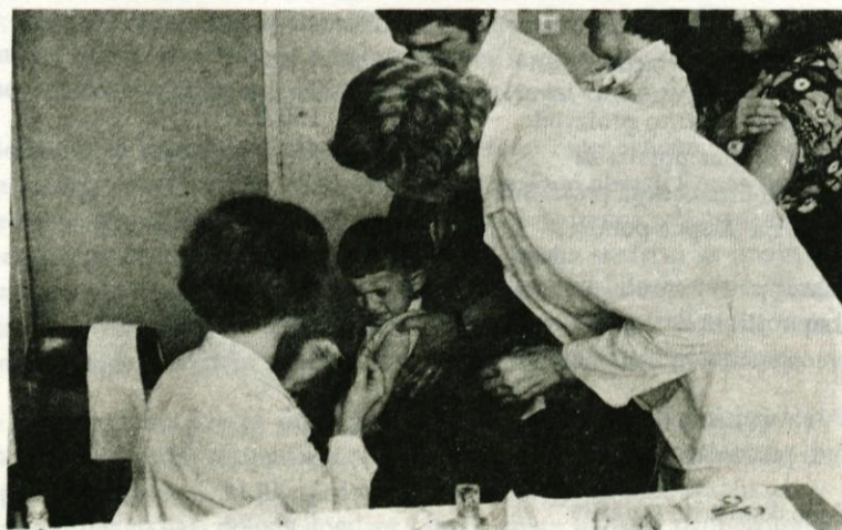
S preventivnimi posegi v zdravstvu želimo pomagati vsem