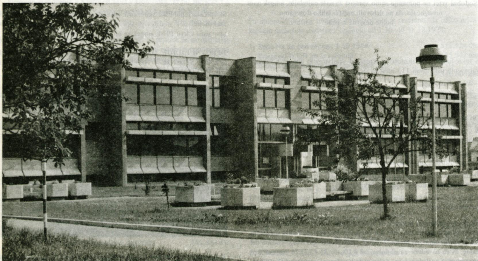
V novozgrajenih šolah lahko naši otroci dobivajo za bogatejšo življenje potrebna znanja

Otroci, ki so poleg rednega pouka še v podaljšanem bivanju in imajo zagotovljeno prehrano, stanejo letno poleg gornjega zneska 4.105,60 še dodatnih 2.200 din za podaljšano bivanje, starši pa plačajo prehrano. (Skupaj, bi lahko rekli, so bili stroški za redno šolanje in celovito podaljšano