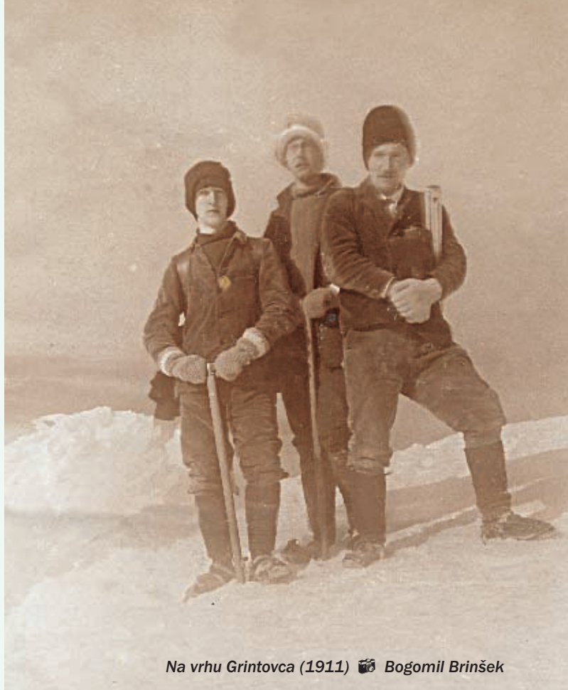
Na vrhu Grintovca (1911)

vi rojstni hiši, njegovo ime nosi planinska strokovna knjižnica v domačem planinskem društvu, v njegov spomin so bile izdane planinske razglednice, pripravljene občasne fotografske razstave »Po poteh Bogumila Brinška« pa tudi 506 m najgloblje odkrito brezno na področju Snežnika, ki ga je odkrilo in raziskalo domače Jamarsko društvo Netopir, nosi ime Bogumila Brinška.