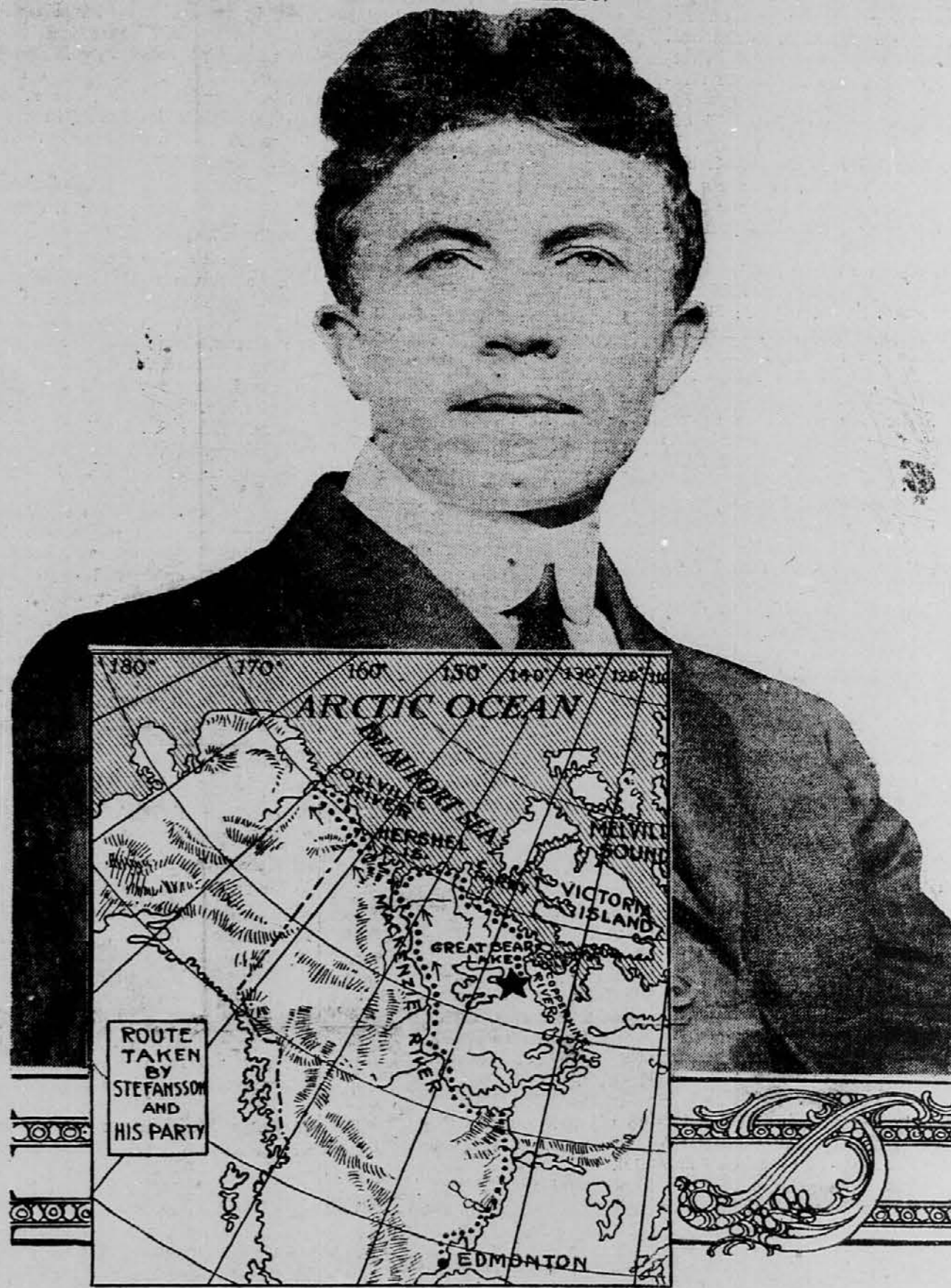
Photo of Steffansson copyright, 1912, by American Press Association.

Pred nedavnem so poročali, da je odkril nek raziskovalec na našem skrajnem severu novo pleme. Naša današnja slika nam kaže drznega raziskovalca, Vilhelm Steffanssona, ki se je pred kratkim vrnil s štiriletnega znanstvenega potovanja, katero je podvzel po nalogu American Museum of Natural History. Steffansson je odkril na skrajnem severu novo pleme, ki se razlikuje od Eskimov v tem, da imajo ti ljudje plave lase in modre oči, ter da njihovi krvi ni primešana mongolska kri. Živijo čisto primitivno, kakor so živeli ljudje v kameniti dobi. Naselili so se na naš skrajni sever najbrže v desetem stoletju iz Skandinavije. Razun članov svojega rodu niso še nikdar videli kakega drugega človeka. Mesto, kjer so bili najdeni ti ljudje, je označeno na sliki s zvezdo.