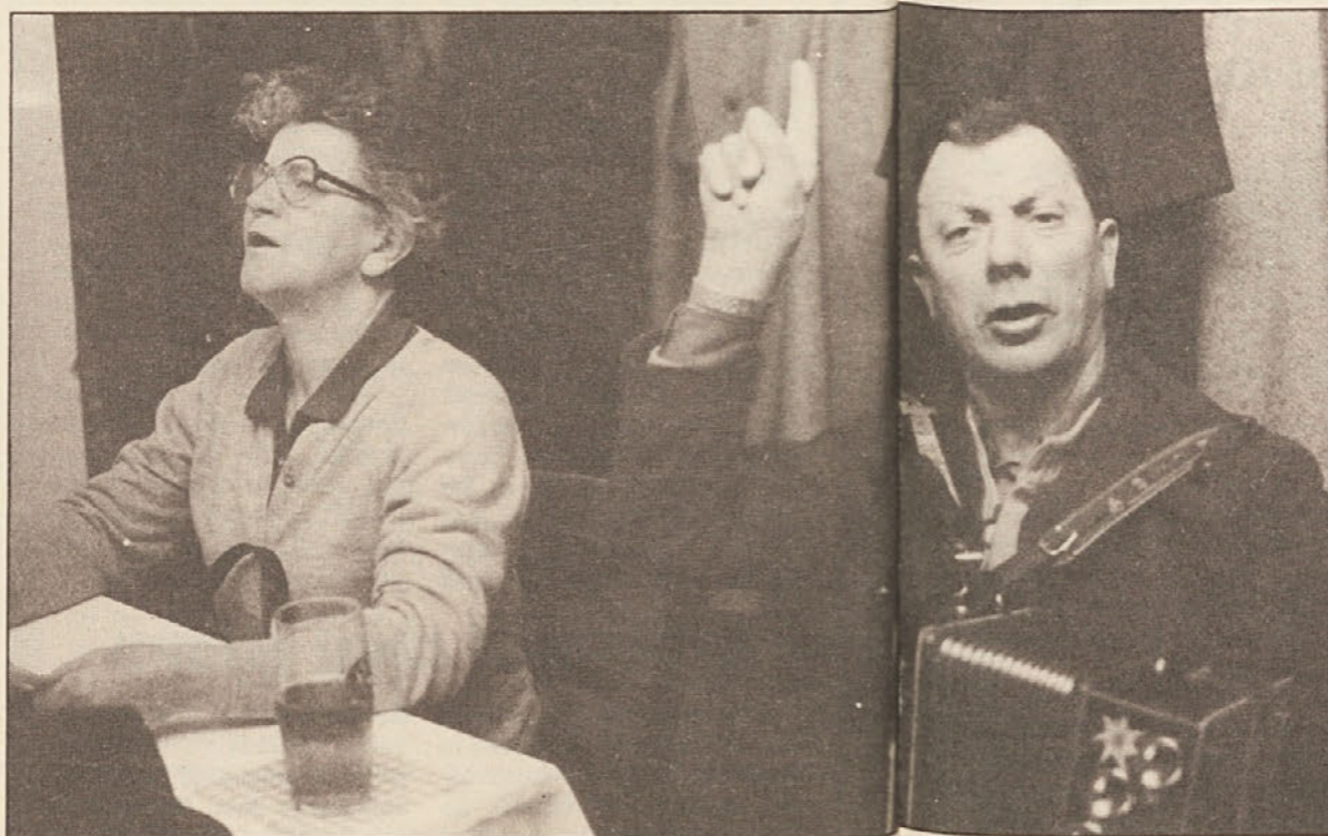
Šiman Male iz Sel je na „lajni hodu“, drugi pa so peljem peli.

Od sobote, 24. 3., 15. ure do nedelje, 25. 3., 17. ure DNEVI MEDITACIJE ZA 7. in 8. razrede srednjih šol, nem. Voditelj: kpl. Ernst Windbichler