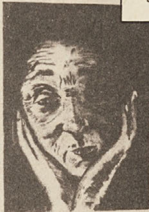
Črno-bele slike E. Arbeitsteina so krepko izstopale na razstavi.