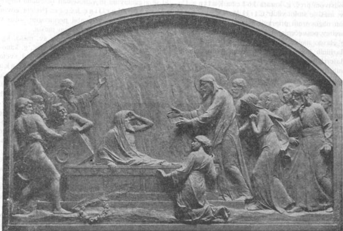
Jezus obudi Lazarja.