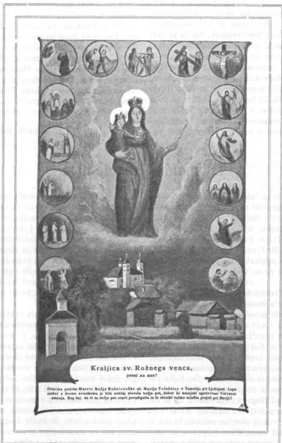
Božjepotna cerkev Marije rožnovenske v Tomišlju.