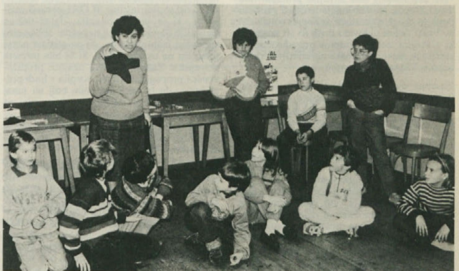
Lonjersko društvo se je v nedeljo posvetilo otrokom in jim organiziralo celodnevno zabavo z naslovom «Direndaj», kjer so v igri spoznali del vaše preteklosti.