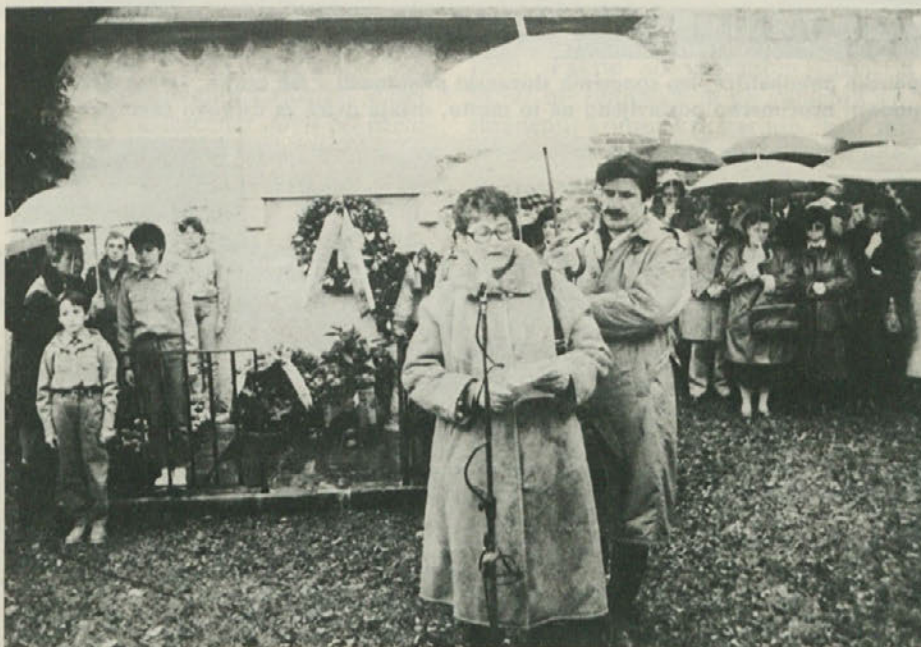
Na openskem strelišču se je v nedeljo vršila svečanost ob 45-letnici ustrelitve obsojencev 2. tržaškega procesa, tudi tokrat ob nerešeni situaciji primerne ureditve kraja.

Na koncu naj še nanizamo vrsto drugih problemov, s katerimi se sooča vzhodnokraški rajonski svet. V prvi vrsti problem razširitve openskega pokopališča, ki zaradi zvlačevanj, zamud in napak je že postal simbol slabega upravljanja. Vse kaže pa, da bo le prišlo do rešitve; čeprav se dela še niso začela. Že star problem je tudi ureditev spomenikov na tem območju in čeprav v proračune tržaške občine že vrsto let vključujejo vsoto, namenjeno temu, je stvar nerešena. V proračunu zasledimo tudi visoke vsote za urbanizacijo novega predela Opčin (Ville Carsie), ki je še posebno pereč in resen, toliko več, če pomislimo, da se za vsako gradbeno dovoljenje (in tu jih je bilo izdanih še pa še) plača težak davek, ki naj bi služil občini za primarno urbanizacijo. Občina se tega problema ni nikoli lotila, tako da je problem asfaltiranja cest, javne razsvetljave, greznične mreže, uslug, kot so vrtci, šole, že na robu kaosa.