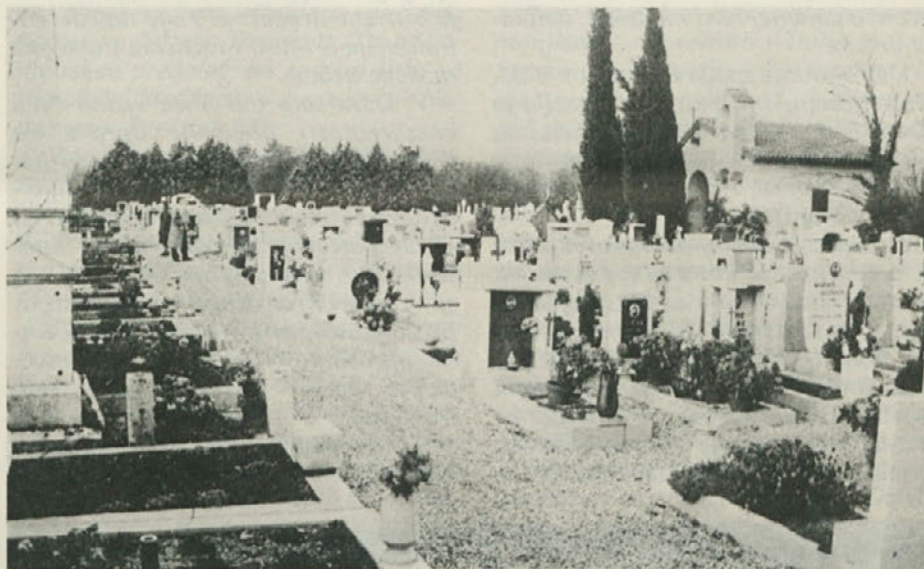
Opensko pokopališče, lep spomenik slovenski prisotnosti v teh krajih. Odlagališče smeti (spodaj), neprimerno postavljeno na to mesto, ostaja ovira za njegovo razširitev.