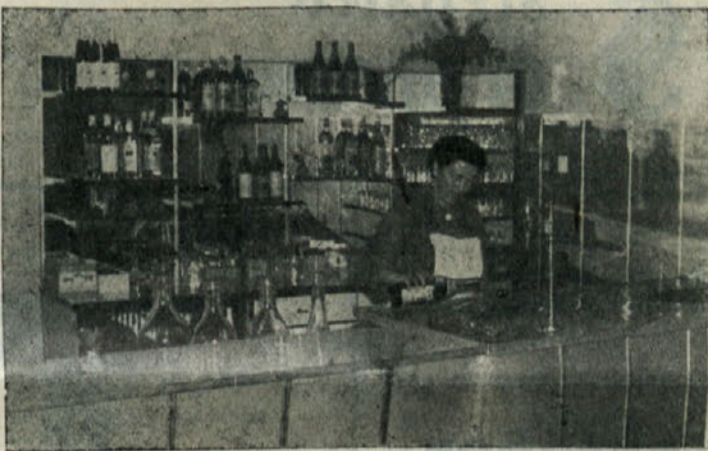
Notranost preurejene gostilne »Pri kmetu«

V ZDA je neko podjetje izdelalo napravo, ki zapisuje podatke elektronskih možganov. V pol minute lahko ta aparat spravi na papir podatke, ki bi napolnili 300 strani debelo knjigo velikega formata. Naj povemo, da piše aparat desetkrat hitreje kot podobne elektronske naprave. — Stroj opravi delo, za katero bi potrebovali 3000 dobrih stenografov.