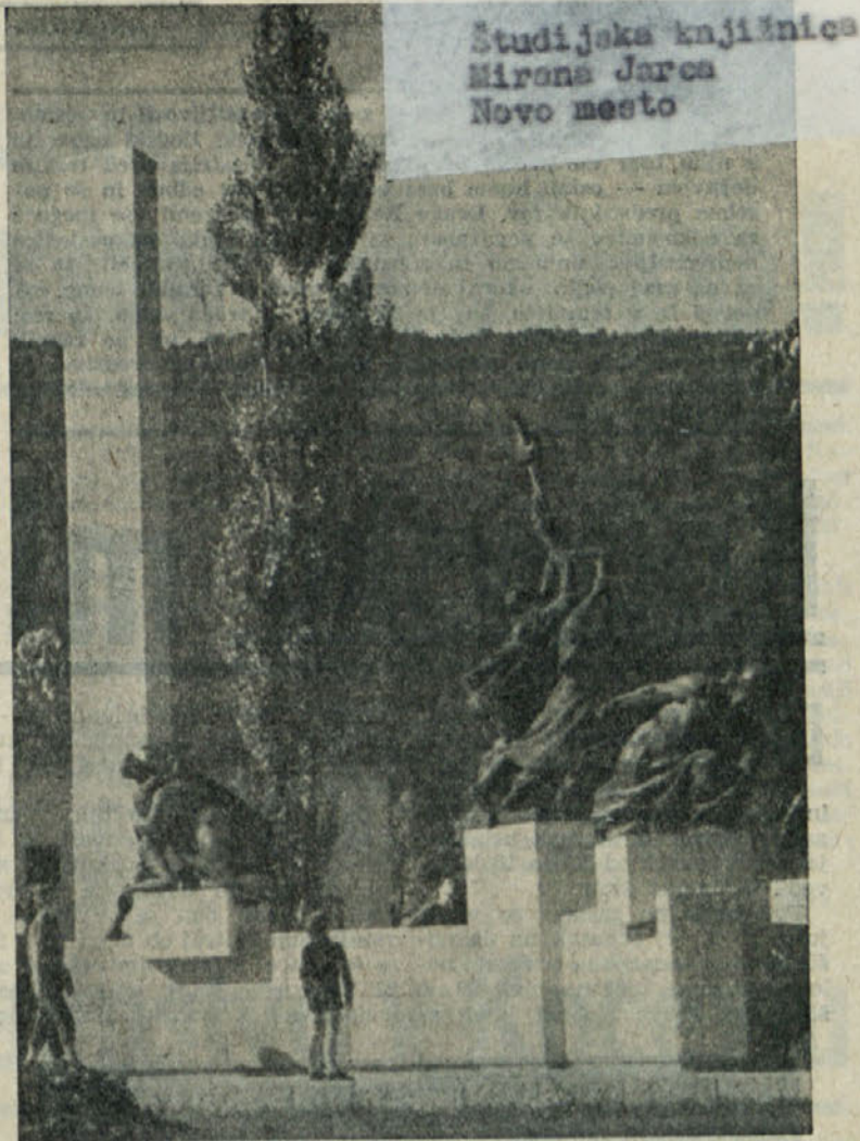
Kočevska občina praznuje 3. oktobra občinski praznik. Na sliki: center Kočevja, spomenik »Osvoboditev«

Stari izrek, da smo rudarji po prirodi konzervativci, ne velja več. Neprestano iščemo novih oblik delovnih prijemov v stalnem strem-ljenju, da bi bilo delo vse bolj uspešno, tako iz tehničnega, gospodarskega in varnostnega ozira. Varnostni službi smo prvi v komun dal posebno mesto v podjetju. (Konec na 2. str.)