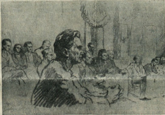
Božidar Jakac: Skica z Zbora odposlancev slov. naroda

Občani občine Kočevje, ki slavijo svoj občinski praznik, ga slavijo v svojih delovnih zmagah, s katerimi se dviga gospodarska moč komun, kar je osnova za še lepše življenje vsakega delovnega človeka v občini. Delovni ljudje so si na jasnem, da so pred nami še velike naloge, katere bomo morali izpolniti, da bo življenje res lepo in