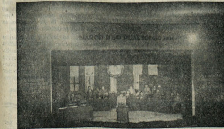
Zgodovinska slika Zbora odposlancev v Šeškovem domu

Titov govor v Generalni skupščini je naletel na širok odmev v svetu, saj so odlomke iz govora prinašali na prvih straneh vsi svetovni časopisi. V svojem govoru