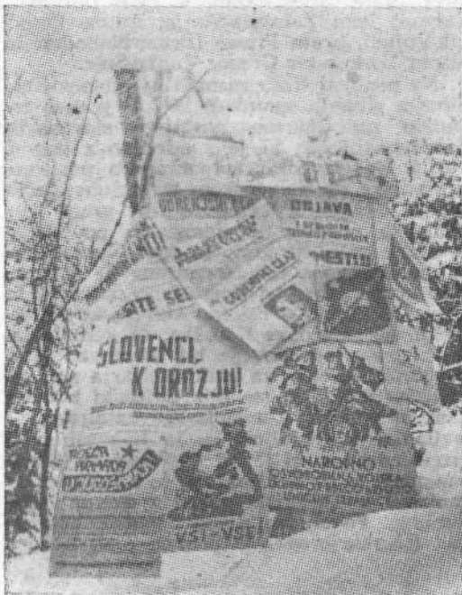
Partizanske tiskarne so natisnile ogromno propagandnega gradiva. Na posnetku je le del tega, kar so natisnili v tehniki pokrajinskega odbora OF za Gorenjsko. Posnetek je nastal pozimi 1944/45.

Tiskarno Donas so postavili le nekaj sto metrov nad Legastjem, še danes cenjeno domačo gostilno, ki stoji ob poti iz vasi Sora proti Topolu. V sosednji grapi pa je delovala tiskarna Trilof. Za obe tiskarni bi lahko rekli, da sta bili na pragu Ljubljane. Zategadelj je bila izredno stroga konspiracija. Kje je tiskarna Donas niso vedeli niti člani gospodarske komisije, ki so jo oskrbovali s