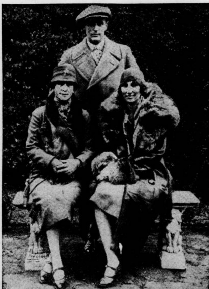
Po uspehi operaciji slepiča je v Londonu nepričakovano umrla norveška kraljica Maud. Kraljico vidimo na gornji sliki s sinom, prestolonaslednikom Olafom in njegovo soprogo, princoso Marto