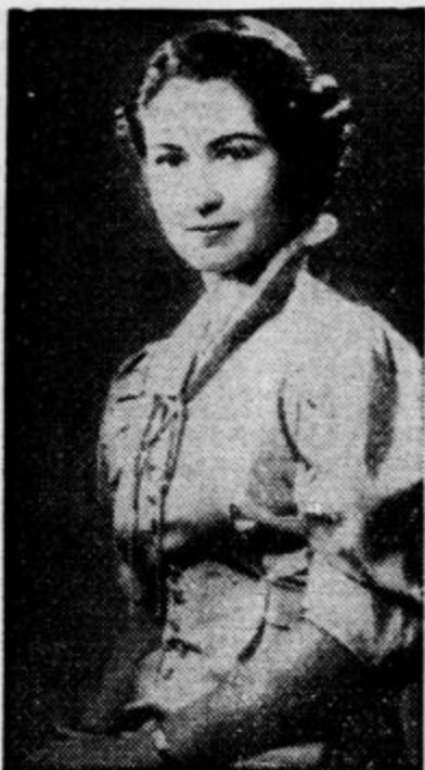
Kakor poročajo iz Kaira je egiptska kraljica Farida (slika) kralju Faruku povila hčerko