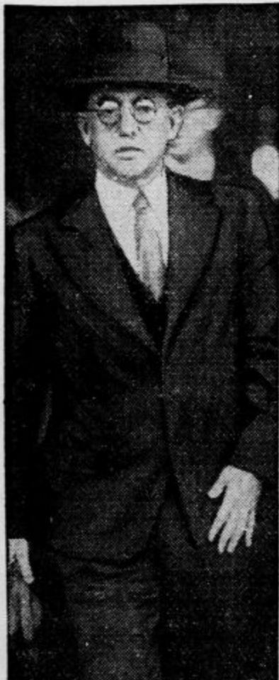
Južnoafriški vojni minister Oswald Pirow (slika) se je iz Anglije napotil v Nemčijo. Njegovo potovanje je baje v zvezi z nemškimi zahtevami po kolonijah