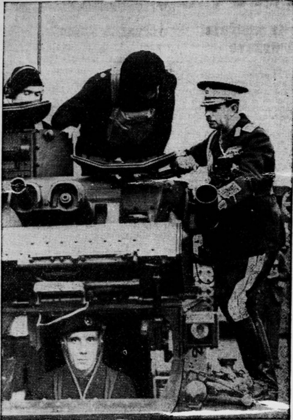
Rumunski kralj Karol si je med svojim bivanjem v Angliji ogledal tudi vojaške naprave v Aldershotu. Posebno so ga zanimali novi topovi (slika).