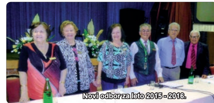
Novi odbor za leto 2015-2016.