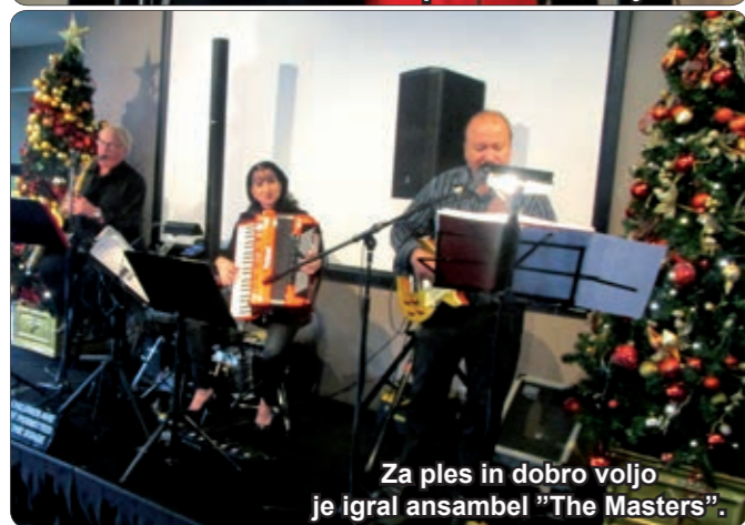
Za ples in dobro voljo je igral ansambel "The Masters".