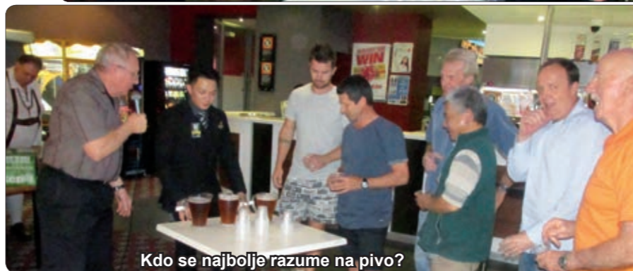
Kdo se najbolje razume na pivo?