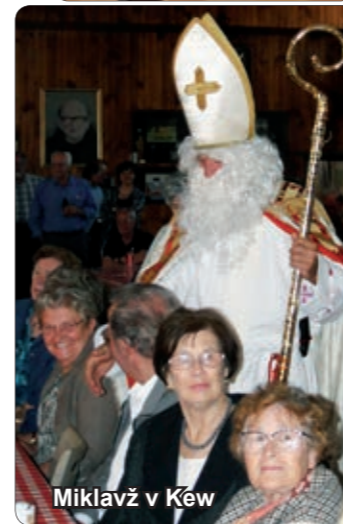
Miklavž v Kew