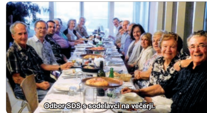
Odbor SDS s sodelavci na večerji.