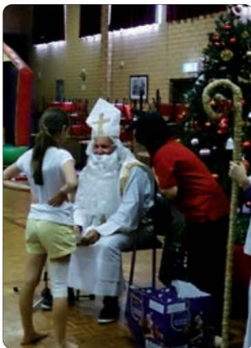
Sv. Miklavž v Slovenskem društvu Adelaide, 29.11.2015.