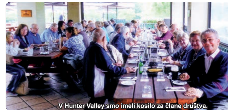
V Hunter Valley smo imeli kosilo za člane društva.