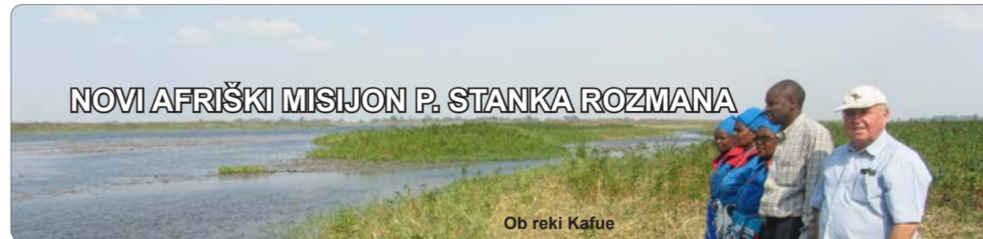
Ob reki Kafue