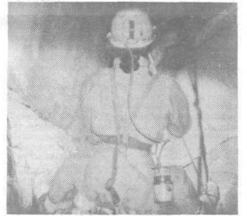
Jamarka v breznu

poleg ostalih kapniških tvorb tudi precej heliklitov, zelo zanimivih kapnikov.