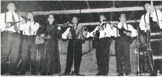
Slovenske ljudske viže s Kostelskega so zaigrali in zapeli Prifarski muzikanti iz Fare ob Kolpi. (V. M.)