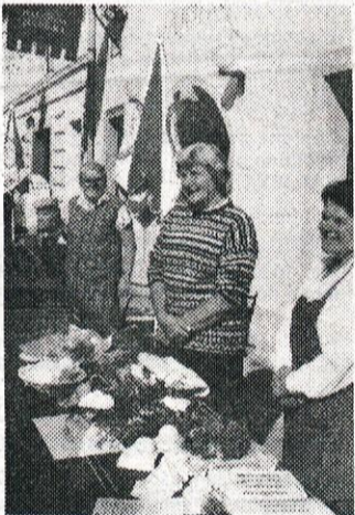
Letos so planšarice med planinskim cvetjem ponudile tudi značilni velikoplaninski sir - trnič.

Za strumen korak udeležencev povorke so poleg domačih godbenikov, ki so jih prvič, si-