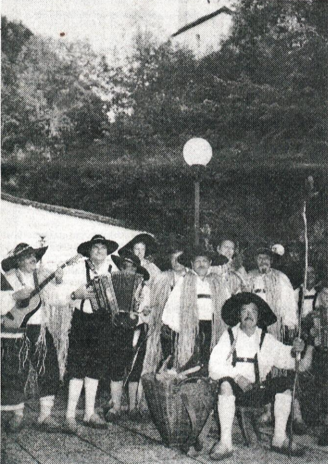
Člani kulturnega društva Planšar so na ploščadi pod Malim gradom predstavili pastirske pesmi, šege in običaje z Velike planine.