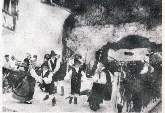
Tudi Trg svobode je letos prvič zaživel z narodnimi nošami. Prav po svoje so ga oživel tudi mladi plesalci iz Vopovelj na Gorenjskem.