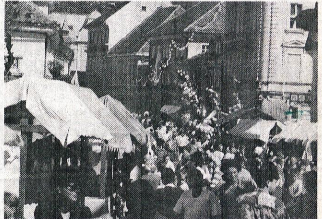
Pravi sejamski vrvež je tiste dni vladal na Glavnem trgu sredi Kamnika.