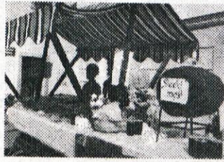
Gospodinje iz Tuhinjske doline so napekle polne jerbabe dobrot. Tudi letošnjega sladkega mošta ni manjkalo.

cer še skromne po številu, spremljale kamniške mažoretke, poskrbeli še godbeniki iz Domžal, Mengša in Moravč.