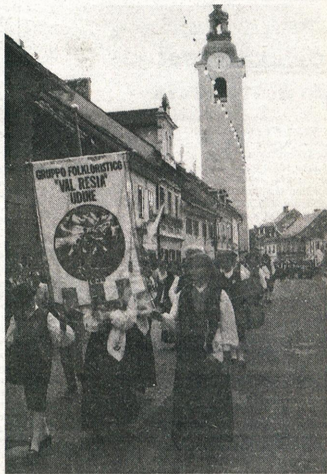
PRAZNIK NARODNE NOŠE – Med živopisnimi nošami iz slovenskih pokrajin so poglede obiskovalcev pritegnile tudi značilne noše Slovencev iz Udin v Reziji.

Poleg osrednjega prizorišča na Glavnem trgu je letos prvič oživel prav za to priložnost ostanek nemškega bunkerja očičen Trg svobode, kulturni in zabavni del prireditve pa je potekal tudi pri bivši knjižnici ob Samčevem predoru, na ploščadi pri kavarni Veronika pod Malim gradom, na tržnici, Trgu prijateljstva in na Trgu talcev za Maistrovim spomeni-