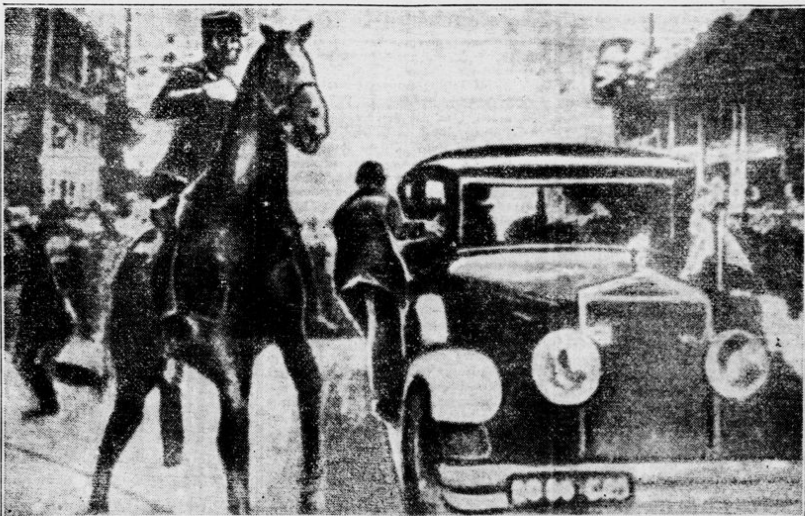
Ogabni zarotnik Veličko Dimitrov Kerin je streljal na blagopokojnega kralja s stopnice avtomobila. Polkovnik Piolet (na konju) ga je po smrtonosnih streljih razsekla s sabljo