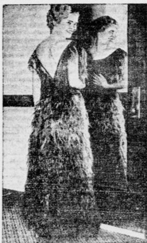
Takšne obleke, ki so v barvi podobne svetloplavim do temnorjavim lasem, so nedavno prikazovale modelke v Michiganu

Ako vas drgnenje in mencanje perla preveč utruji, potem uporabljajte