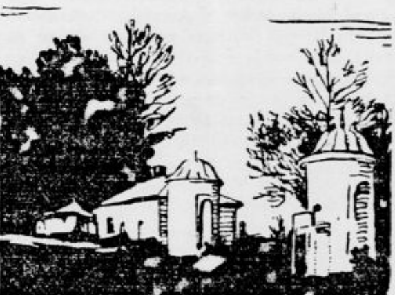
Jasna Poljana, kjer je pokopan Tolstoj

Tolstega so položili na oder v hiši, kjer