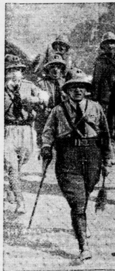
Bivši italijanski finančni minister Guido Jung na čelu svojega vojaškega oddelka v severni Abesiniji