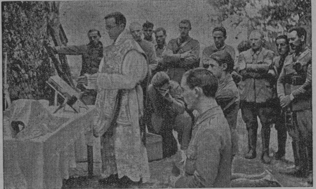
Uporniško vojaštvo prisostvuje sv. maši na fronti v okolici Iruna v severni Španiji.