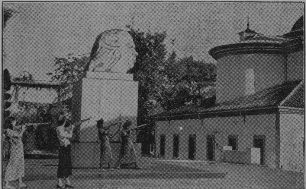
Španske komunistke oblegajo cerkev.