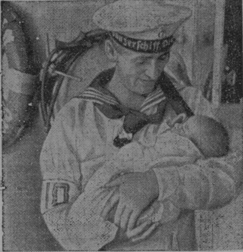
Nemška oklopnica je vzela na svoj krov tri tedne starega španskega begunčka.

peljavo v bolnico je revež izdahlil. Smrtno ponesrečeni zapušča dvojčka, katerima je letos 14. julija umrla mati na porodu.