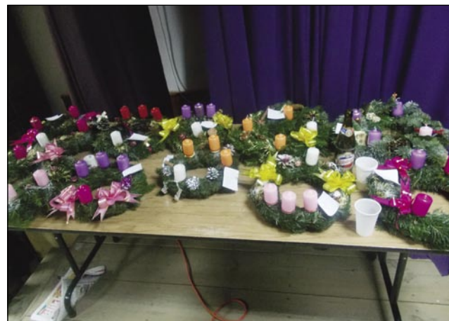
Adventni venci so delo pridnih rok domačink

smo delali v letu 2014, kakšne prireditive, programe smo imeli in kakšen je bil naš proračun. Vsem sem se zahvalila za pomoč pri organizaciji in izvedbi programov, moja zahvala je veljala tudi za tiste, ki so prihajali na naše prireditve.