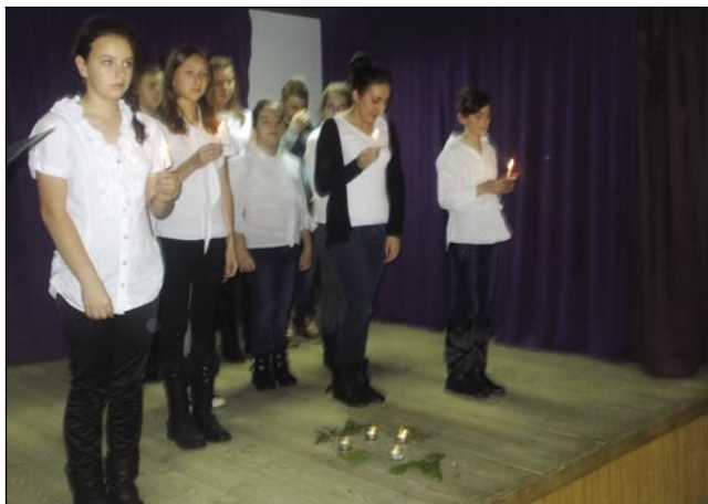
Učenci DOŠ Števanovci so pripravili praznični program

Hvala vsem, ki ste bili z nami. Vsem želim vesele, mirne in blagoslovljene božične »svet-