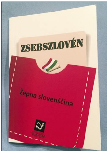
Tako lahko slovenščino spravimo v žep...

Pri vsakem slovenskem izrazu je označeno mesto naglasa, kar madžarskim