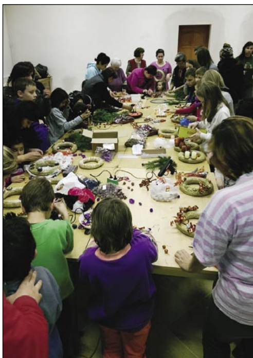
Sakalovski kulturni dom se je ta petek napolnil z mamicami in otroki, bobicami in vnuki

se še zahvalila za podporo Sombotelskemu gozdnemu gospodarstvu in za pomoč predstavnikoma slovenske