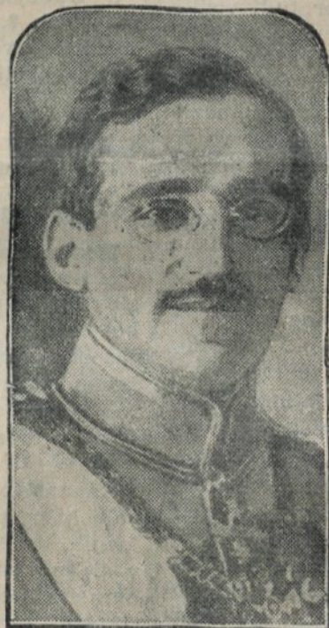
Nj. Vel. kralj Aleksander I.