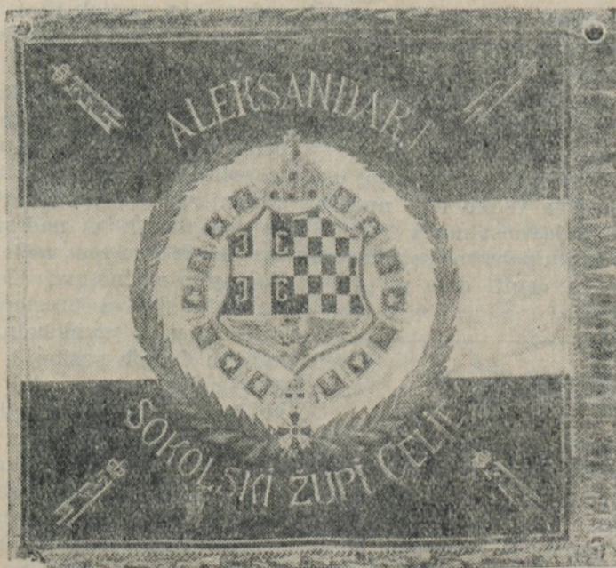
Prapor, ki ga je poklonil celjski sokolski župi Nj. Vel. kralj Aleksander I.