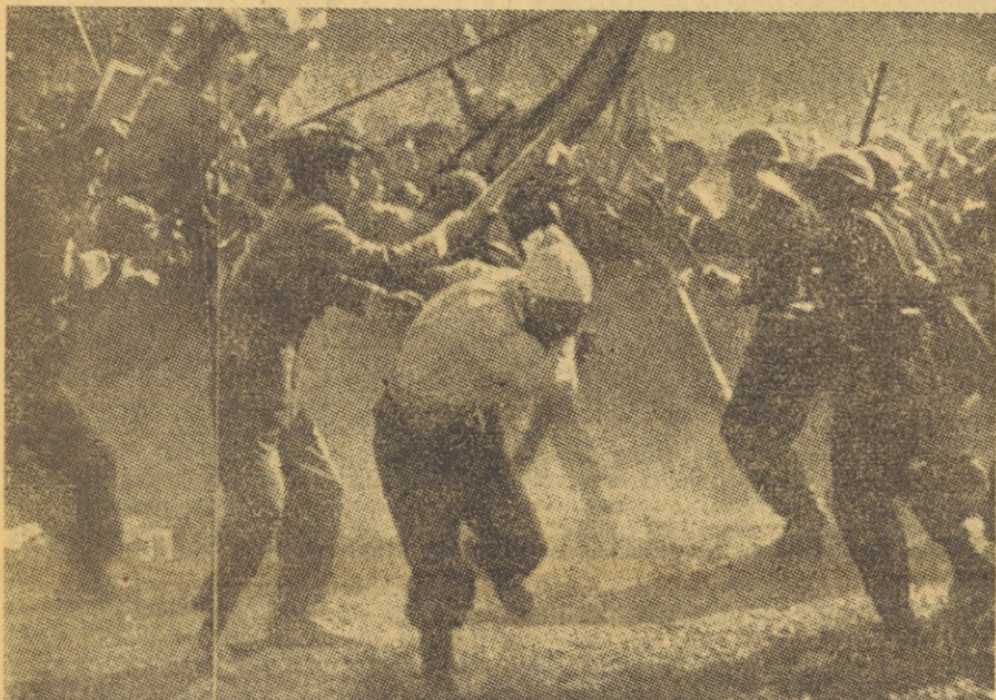
Prvi maj na Japonskem. Na trgu pred cesarsko palačo se je v demonstracijah zbralo nad 10.000 delavcev, študentov in korejskih priseljencev, ki so se spopadli z 2000 policaji. Delavci in študentje so bili oboroženi s kamenjem in z bambusovimi palicami, nabitimi z žebli. Policiji je uspelo demonstrante razgnati šele s solžnim plinom. Na ulici je obležalo več mrtvih in 1545 ranjenih. To je bil najbolj krvav spopad na demonstracijah, ki jih je bilo na ta dan 33 po vsej Japonski in v katerih je sodelovalo okrog 1 milijon Japoncev.

Čeprav delodajalci proze, da bodo tožili sindikate, so leti priredili še več velikih protestnih stavk in demonstracij. Prav sedaj pripravljajo veliko zborovanje v Dortmundu, kjer bi se zbrali delavci Zapadne Nemčije. Samo v Frankfurtu so pretekli teden demonstrirali 100.000 delavcev.