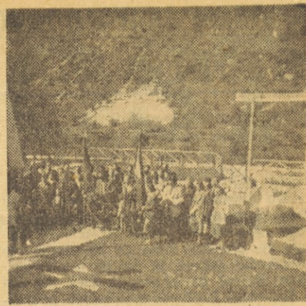
Člani sindikalne podružnice »Ilirija« so obiskali grobove talcev v Drago pri Begunjah

Kakor vidimo, uspešno delujejo predvsem javne sindikalne knjižnice, ker poslujejo redno in imajo širok krog bralcev. Sindikalne knjižnice, ki izposojajo knjige samo članom svojih podružnic in poslujejo v večji meri precej neurejeno, pa imajo manjši uspeh. Milan Kerin