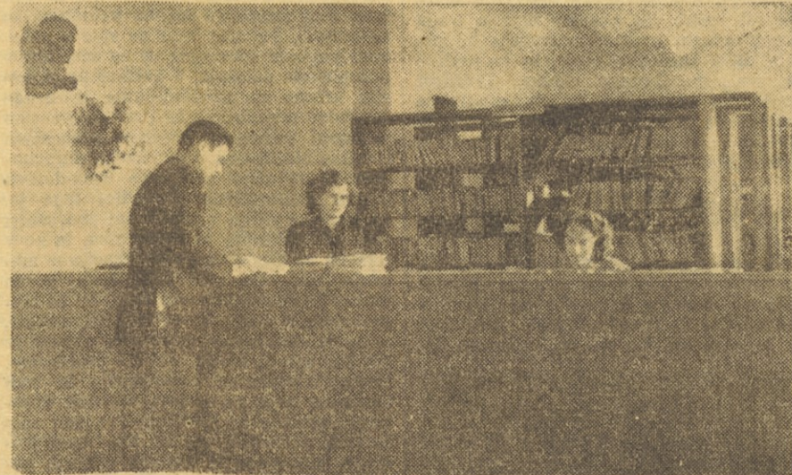
Delavska knjižnica v Mariboru