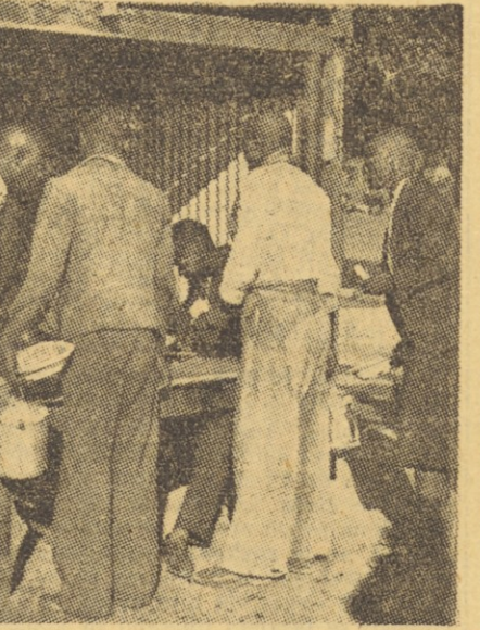
Na sliki vidimo črne delavce, ki z listkom in posodo v rokah čakajo na borno kosilo.

Ker ne vidijo nikakih možnosti za izboljšanje svojega življenja, se je tisoče in tisoče črncev vdaljo plačati v zločinu. Belci žive v stalnem strahu pred Skolev Boys — zločinski skupino črncev, ki ima svoje sedeže po predmestjih in ki je poznana po tem, da