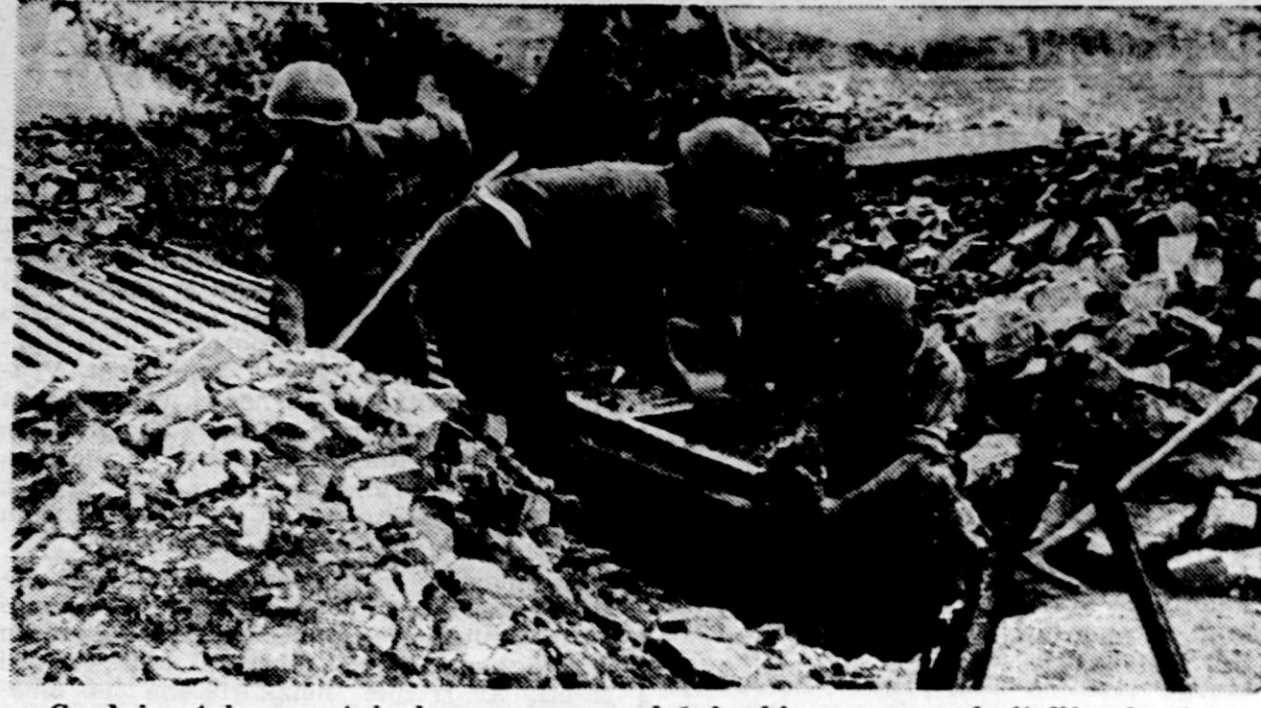
Gradnja utrjene postojanke na novem položaju, ki so ga zavzele italijanske čete ob Donu

Cetrti rod notranjskih prebivalcev so pravi Kranjci, namreč tisti pri Vrhniku, Plaini, Logatcu in drugod. Po vrhni so sami tovrstniki, ki prenašajo na konjih vino iz Vipacca, Triesta, s Carsa, iz Gorizije, a tudi drugo, iz Benetk prihajajoče blago ne le v Ljubljano, ampak tudi v Gradec, na Dunaj in še drugam... Dolina Vipacca se začinja pri Podkraju in sega do Vipacca, S. Vita in tam okoli.