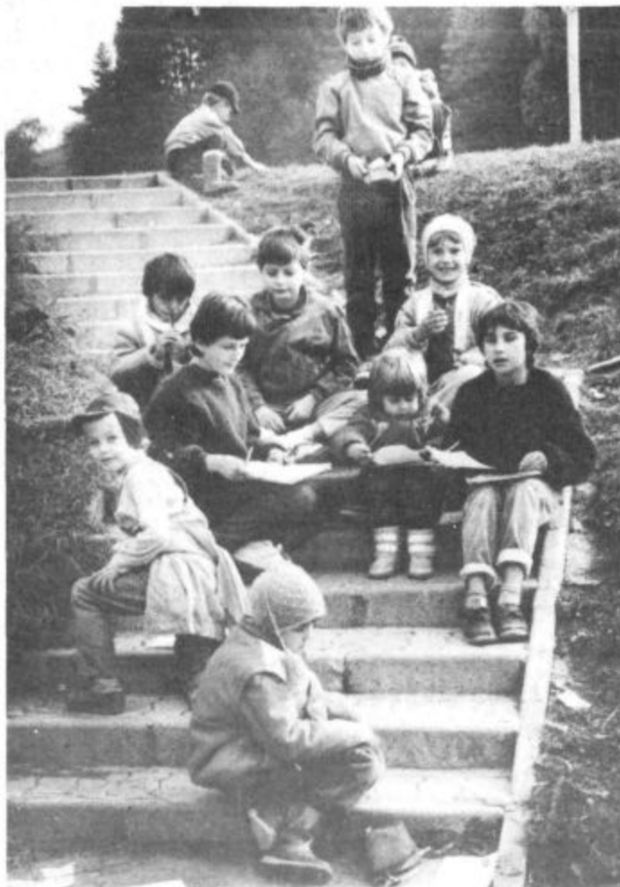
MLADOST NA STOPNICAH — Jesen nam ne prizanaša z mrazom, našim najmlajšim pa ta ne pride do kosti. Zabavo in družbo si vedno najdejo, če nimajo kam drugam, pa na stopnice... (bz)