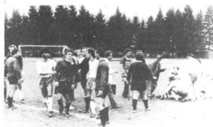
Kipelo je še po zadnjem sodnikovem pisku, bilo je tudi boleče