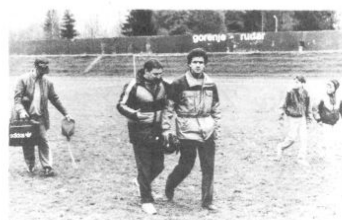
... le zakaj se ne bi imeli. (VOS)

Če vedenje na nogometnih igriščih — in predvsem ob njih — karkoli kaže na naše značaje, potem smo s krepostjo našega duha in z moralo na psu! Pa še to je groba žalitev rodu naših zvezstih štirinožnih prijateljev. J. P.