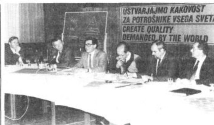
Premakniti kakovost iz proizvodnje v trženje in razvoj, to je bil samo eden od zaključkov 2. konference o kakovosti, prejšnji četrtek v Topolšici.

Sklenili pa so tudi, da bodo nadaljevali z obiski po organizacijah združenega dela, kjer še niso začeli oziroma se še niso lotili organiziranega pristopa h kakovosti, torej s širšo družbeno akcijo s kakovostjo priti v vse sredine. S konference pa so posali tudi pobudo Gospodarski zbornici Slovenije in njenemu Svetu za kakovost, da tudi v obliki materi-