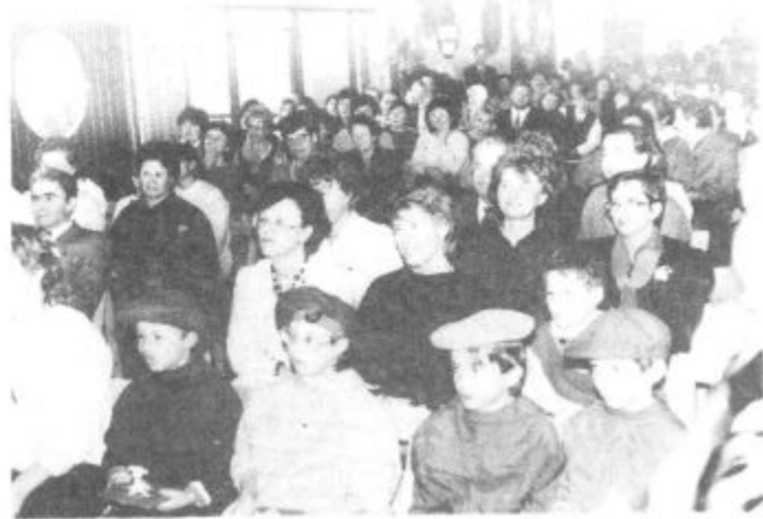
Proslave ob 30-letnici šole s prilagojenim programom v Titovem Velenju se je udeležilo veliko staršev in gostov