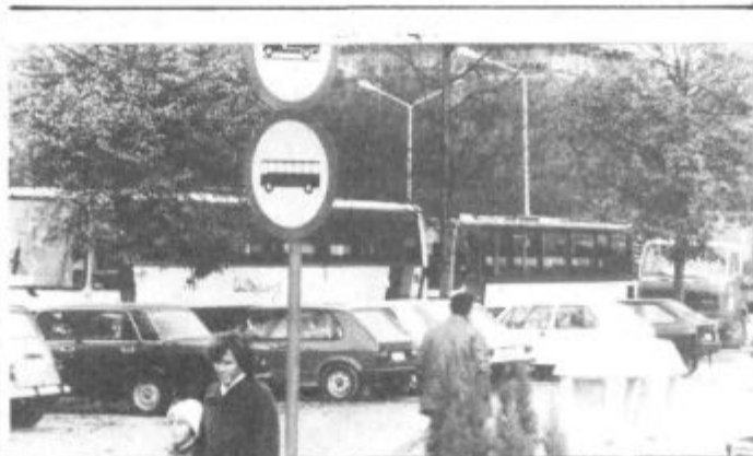
Strožji prometni predpisi že nekaj časa veljajo, nekateri pa še vedno ne vidijo prometnih znakov! In to celo poklicni vozniki avtobusov in tovornjakov.