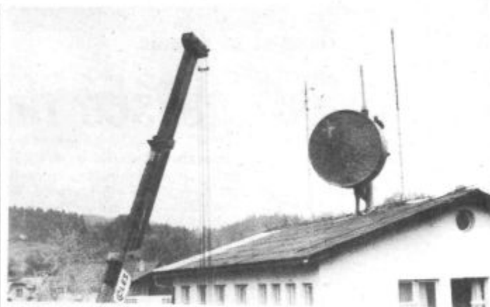
Napredek pri delih je zlasti »viden« na mozirski pošti

Seveda program podrobno opredeljuje delež sredstev posameznih nosilcev. Podjetje za PTT