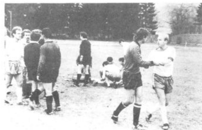
Je to bila polka ali valček, ali pa — »mi se imamo radi...«