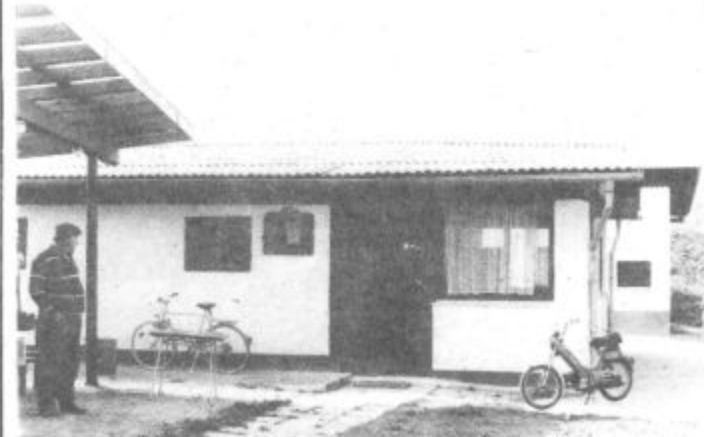
Iz bivše čolnarne je nastal lep dom velenjskih ribičev