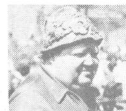
»Nič nimamo proti, če kanec vsega tega veselja ostane tudi za ostale dni.« je sredi najživahnjšega tabornega vrveža porekel nek Polhograjec. »Vse te naravne lepote tod okoli so na voljo vsakomur.«

»Blagajana«, čeprav brez večjih izkušenj, je tako vsekakor uspešno prestala svoj test. A tako kot to, prizadevno in vsestransko društvo, bržčas tudi sama turistična ponudba v kraju, ki se vedno pluje v širokem toku neizkoriščenih možnosti.