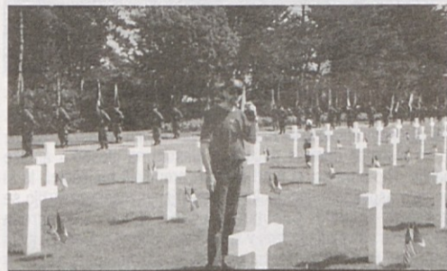
Ameriško vojaško pokopališče Omaha beach