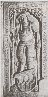
Nagrobnik Erasma Wagnerja, umrlega 1522 (z. c. Šmartno pri Litiji)

Na osnovi vladnega patenta se je l.1550 začelo preganjanje protestantskih rudarjev, kar je ohromilo obratovanje litijskega kot tudi mnogih drugih vzhodnoalpskih rudnikov. Rudarstvo je na našem območju počasi zamrlo in si ni opomoglo vse do 19. stoletja.