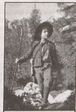
Kekec z naslovnice knjige Kekec nad samotnim breznom