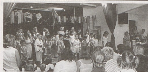
Najprej so oder zapolnili prvošolci. Športno oblečeni in s kole-sarskimi čeladami na glavi so zapeli simpatično pesem Kolo.

Zadnji šolski dan so učenci razredne stopnje povabili v šolo svoje starše in prijatelje ter se skupaj z njimi poslovili od šolskih klopi. Pripravili so glasbeno prireditev, le-tej pa je sledila še malce bolj resna podelitev spričeval.