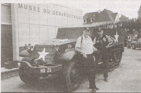
Pred muzejem v Arromanches-u

Častniki iz Brežic in Litije so si ogledali vojaški muzej v Arromanchesu, mestecu na obali, kjer so se izkrcali ameriški vojaki in pa obrambne položaje nemške vojske na obali, ki so jo zavezniške sile poimenovala OMAHA BEACH. Tu je nemški vojaški stroj utrdil obrambne položaje z dvema vrstama bunkerjev. V prvi vrsti tik nad obalo so postavili bunkerje za strojnična gnezda, v drugi vrsti pa so utrdili položaje artilerije, ki je s svojim močnim topniškim ognjem kosila smrt med zavezniškimi vojaki že na morju, še preden so se ti uspeli izkrcati. Tudi obisk vojaškega pokopališča ameriške vojske na obali Omaha beach, kjer je pokopano 9.387 ameriških vojakov, so na častnike naredili velik vtis. Dodatno pozornost je pritegnila še vaja sodelujočih vojakov na slovesnosti ob obisku ameriškega predsednika Georja Busha. Veliko število sodelujočih veteranov (Američani, Angleži, Kanadčani, Nemci), ki so imeli na prsih