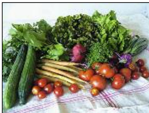
Figure 4: Vegetable of producers from surrounding area of larger cities

Increased support for organic agriculture should include more promotion, (since consumers are not sufficiently informed), higher levels of subsidies, and rewards for outstanding achievements in the field of environmental protection. Value added is provided in developing and marketing environmentally friendly products. Organic food products achieve, on average, almost twice the price of other products (Slabe et al. 2010). Support should include establishment of new connections among farmers for collaboration in providing large quantities of supplies for large purchasers. In addition, there should be consumer (farming partnership, boxes), associations (for promotion of healthy lifestyles), development of local markets, and promotion of local and traditional specialties. Participation of farmers in societies would provide them with support in adapting to change, while increasing their independence and promoting the links between agriculture and other industries (tourism, food processing, and mechanical engineering), in rural areas (Ogden 2002).