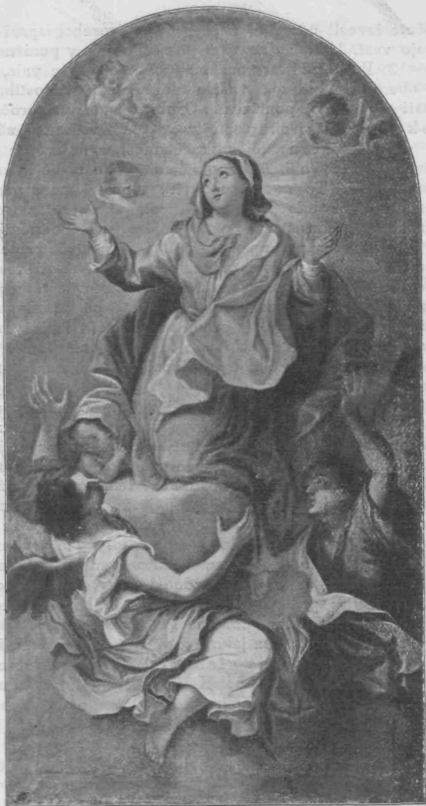
Vnebovzetje Device Marije.