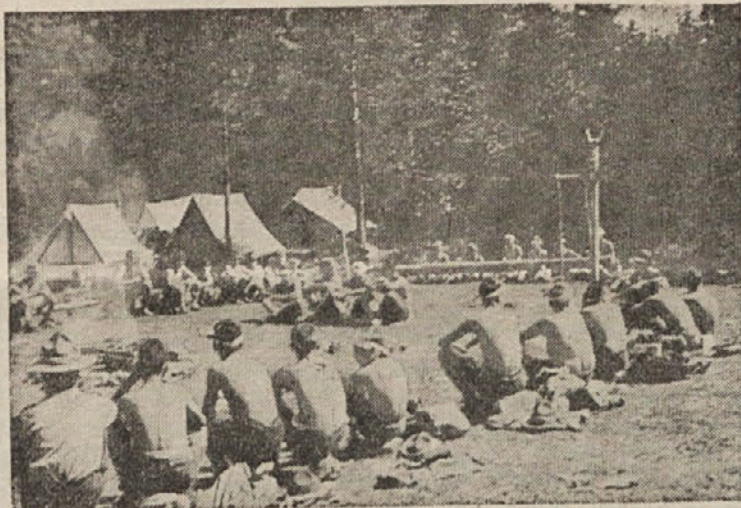
Ob tabornem ognju, ki je najlepši dogodek skavtskega življenja, so se zbrali naši mladi nadobudni skavti.

Po večerji smo šli na prostor, ki je bil določen za taborni ogenj. Ogrnili smo si odeje, postajalo je namreč hladno in nihče ni hotel biti bolan. Taborni ogenj je najlepši dogodek skavtskega življenja. Vsak skavt se ga veseli. In zakaj ne? Koliko je petja, smeha, veselih dovtipov, prizorov, ko ogenj prasketa in obseva obraze skavtov. Nad njimi je zvezdnato nebo, povsod pa nočna tišina in mir. Prvič smo se zbrali v krogu okoli pripravljene piramide suhih drv. Stopila sta naprej dva člana voda ješenov, ki je pripravil drva, da bosta prižgala ogenj. Pristopil je tudi brat starešina, da ugotovi, koliko vžgalic bosta uporabila. Gre za točke. Čim več jih kdo uporabi pri prižiganju, tem manj točk dobi vod. Zato je treba paziti in se potruditi. Točke so dragocene. Ko se je pokazal plamen, je intoniral brat Franc pesem in vsi drugi smo poprijeli: