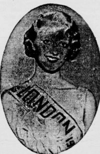
V nekem velikem londonskem kinematografu je bila pred kratkim izvoljena za miss Anglijo 1935 miss Ema Bankeadova