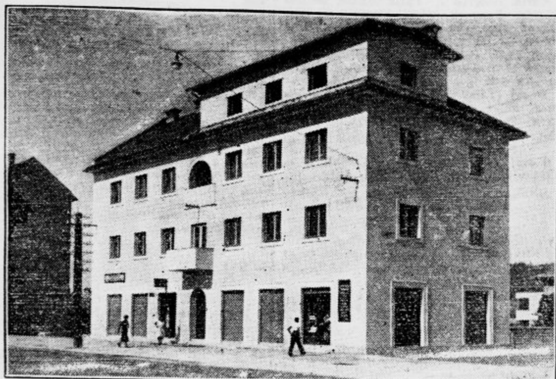
Dom poštarjev v Ljubljani bo danes ob 14. slovesno otvorjen. Dom stoji na vogalu Tyrševe in Smoletove ulice, graditi so ga začeli lani 17. avgusta, stroški so znašali 1 milijon Din. Gradila je tvrdka Mavrič in tudi notranjo opremo so oskrbeli domači obrtniki.