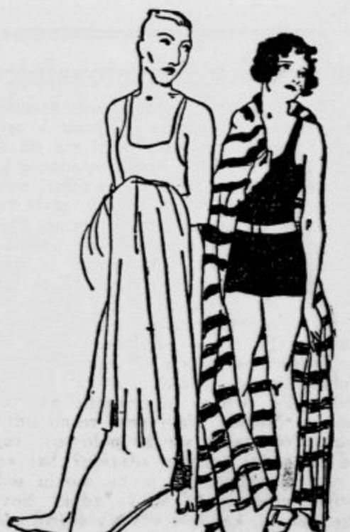
»Noč in dan sanjam samo o tebi, draga...« »Zato si torej vedno zaspan tako?«