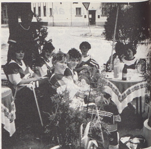
Počitek po zmagi v Osijeku so si odbojkarice Gorenja pošteno zaslužile.