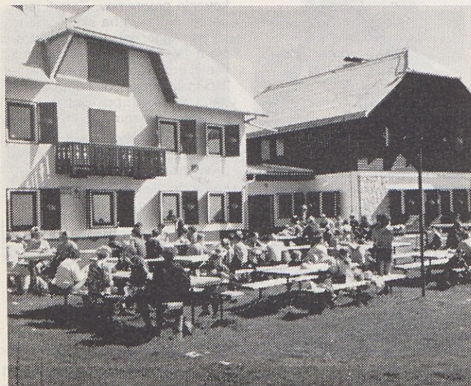
Počitek na vrhu Uršlje gore se prileže.

INFORMATOR, list za obveščanje delavcev delovnih organizacij in skupnosti Gorenja v Titovem Velenju. Gorenja Mali gospodinjiski aparati Nazarje in Gorenja Naravno zdravilišče Topolišica. Družbeni organizatorji dejavnosti. Ureja Uredniški odbor – Glavni in odgovorni urednik: Hinko Jerčić. Izhaja tedensko. Naklada 9650 izvodov. Grafična priprava, tisk in odprema: REK DO Tiskarna Titovo Velenje. Oproščeno premetnega davka po sklepu 421-1/72 z dne 23. 1. 1974. Poština plačana pri pošti Titovo Velenje.