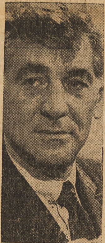
ZALOSTNO — Tako je dejal dirigent New York Philharmonic Leonard Bernstein o zavrtačanju zgodnje klasične glasbe, ker je nastala v "buržujskih deželah", ko so ga zadnjič tekom njegovega obiska na Japonskem vprašali, kaj sodi o tem.

Minister za energetiko Donald McDonald je objavil, da bo Kanada zmanjšala izvoz svojega olja v ZDA. Kljub temu bo olja v Kanadi začelo primanjkovati in že leta 1982 tega ne bo dovolj več za domače potrebe, če bodo zgradili oljevod od Sarmie do Montreala. Do tega zaključka je