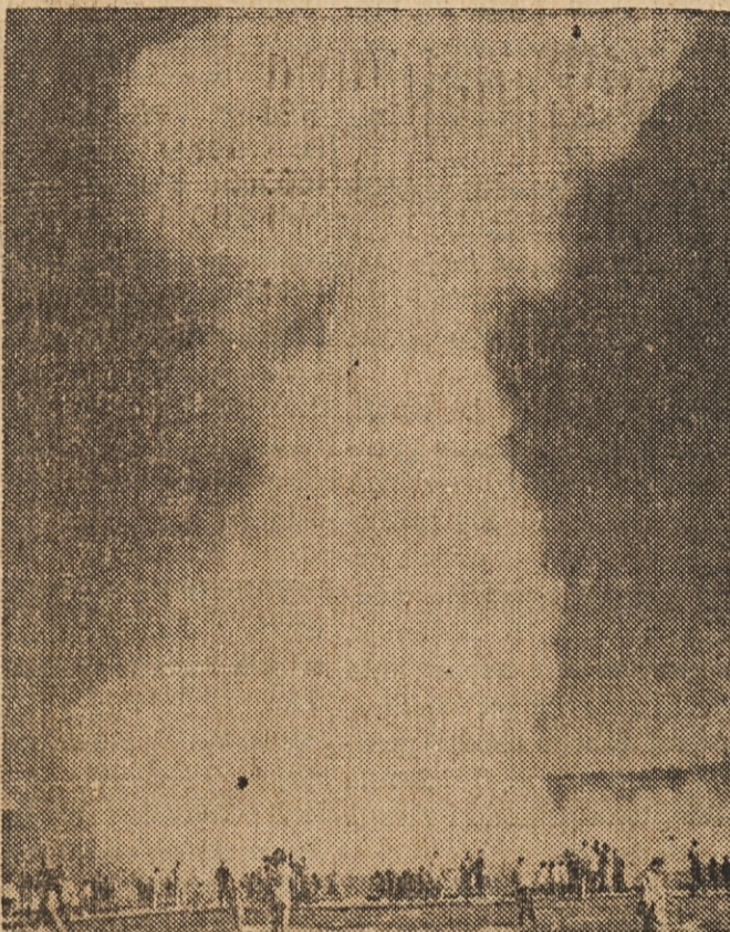
"STARI ZVESTI" je najbolj znan gejsir v Yellowstone National Parku, ki ga vsako leto obišče na tisoče ljudi iz vse Amerike, pa tudi iz prekornorja.