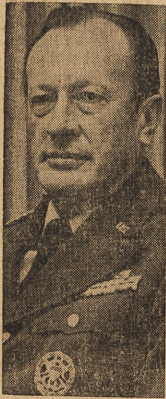
GEN. F. C. WEYLAND je bil po smrti gen. Abramsa imenovan za načelnika armadnega glavnega stana.