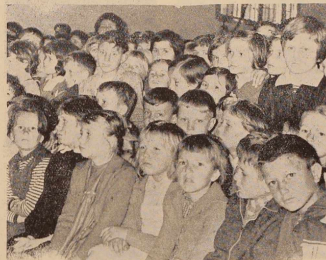
Dan mladosti bodo praznovali že kot pionirji — z rdečo rutico