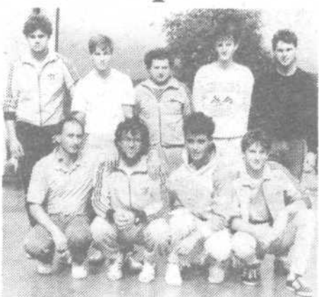
Na turnirju v malem nogometu se je najbolje odrezalo moštvo »Jama Berda« iz Podpeč-Preseje