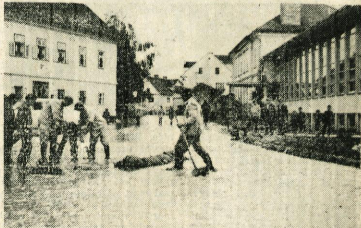
Občani se trudijo, da bi obvarovali pred poplavo spodnje prostore mengšeške osnovne šole. Mengšeške ulice so se spremenile v fanale