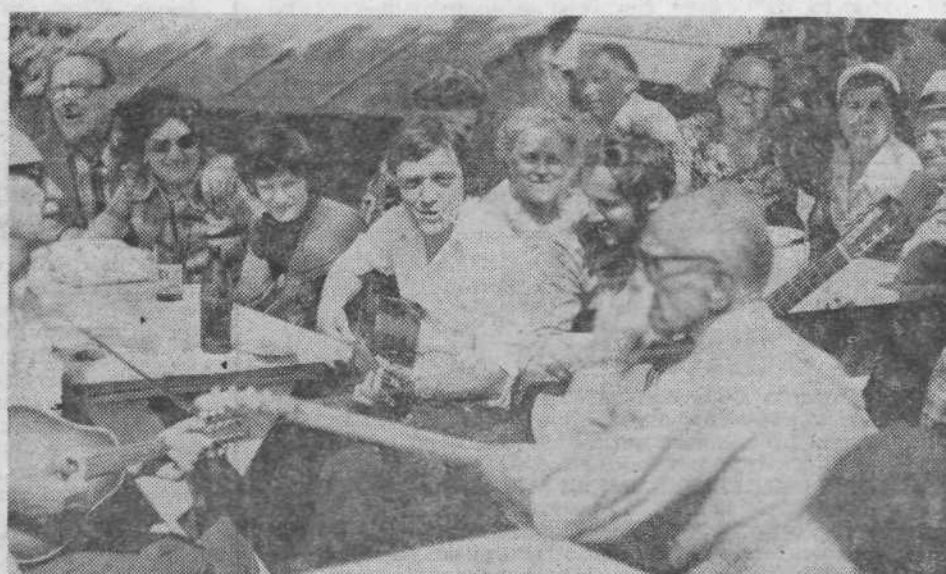
Prešerna pesem veselih ljudi.