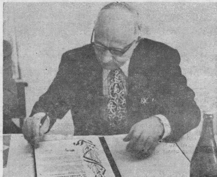
Predsednik KS Tabor Uderman ob podpisovanju listine.