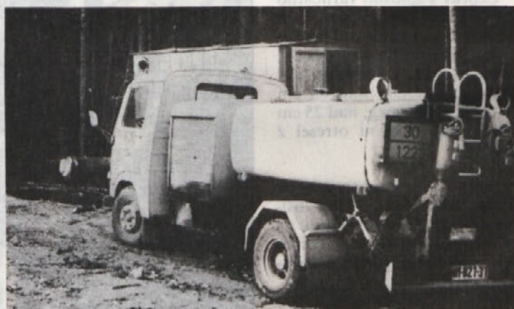
Tozd Transport in gradnje je vse bolj opremljen. Na fotografiji je 2500-litrska cisterna, ki prihrani mnogo poti pri oskrbi z gorivom. Drži približno toliko, kolikor goriva naši kamioni porabijo v enem dnevu.