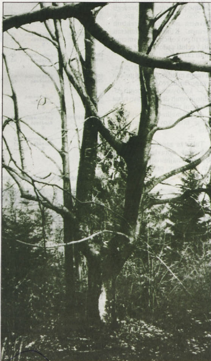
Spredaj zanimivo lep koš, zadaj že sadovi premene.

Ker predstavljajo zimske sečnje v določenih ekstremnih podnebnih ali terenskih razmerah ter v njihovih medsebojnih kombinacijah (sneg—mraz—pledica—žled...) izredno povečano nevarnost za poškodbe in zdravje delavcev, bi bilo prav gotovo potrebno ugotoviti in nato opredeliti razmere, pri katerih je treba z delom v gozdu prenehati. Pri reševanju tega vprašanja bi morali poleg gozdarskih tehnologov sodelovati strokovnjaki za varstvo pri delu, zdravniki, specialisti za medicino dela, strokovnjaki za fiziologijo dela ipd., ki bi lahko