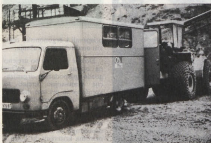
Premična servisna delavnica za popravilo gradbenih strojev in kamionov je že velikokrat dokazala svojo koristnost.

že sedaj v doseženih količinah kazalcih o odkazilu, o gozdni proizvodnji in o opravljenih gozdnogojitvenih delih. Ti kazalci označujejo naš uspeh sicer samo enostransko, ker ne osvetljujejo dovolj vsebine opravljenega dela.