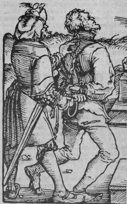
UJETNIK Z OBROČEM OKOLI VRATU