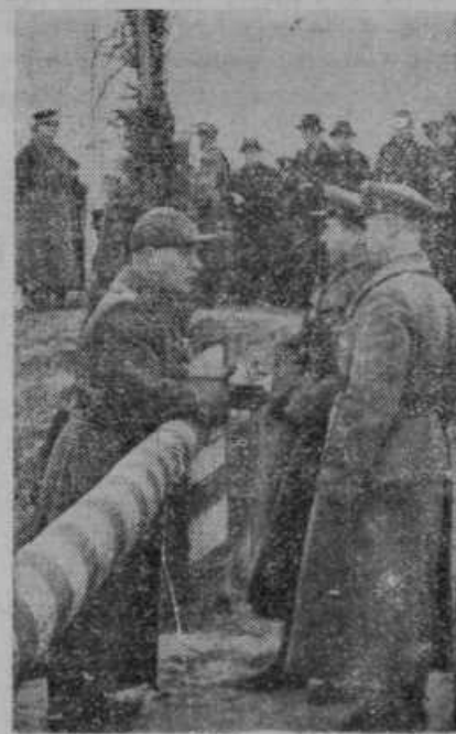
Litvanski vojak (levo) v pogovoru z rusko posadko ob novi meji Litve pri mestu Vilni, ki je pripadalo pred to vojno Poljski