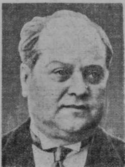
Kjuseivanov, predsednik bolgarske vlade, katero vabijo ruski sovjeti in Nemčija v svoje tureže

V razpravi o četrti banovini je tudi bil stavljen posredovalen predlog, naj bi se Bosna in Hercegovina vpostavila kot samoupravna gospodarska celota, toda brez zakonodajne oblasti. Tudi ta predlog ni našel milosti ne v očeh srbskih strank ne pri HSS. Glede na tretjo banovino (Srbijo), ki naj bi obsegala vse ozemlje izven banovine Hrvatske in banovine Slovenije, poudarja »Hrvatski dnevnik«, da se mora obseg te banovine določiti v sporazumu s Hrvati, kakor se je obseg banovine Hrvatske določil v sporazumu s Srbi. Ker ima o preureditvi države izreči končno besedo parlament, so se že začela pripravljala dela za parlamentarne volitve. V to svrhu je bil poleg imenovanega odbora za proučevanje vprašanja o preosnovi države v vladi ustanovljen še drug odbor ministrov, ki naj izdela nov volilni zakon in izvrši druge volilne priprave. Kakor se poroča, se bodo volitve za narodno skupščino vršile v bližnji bodočnosti.