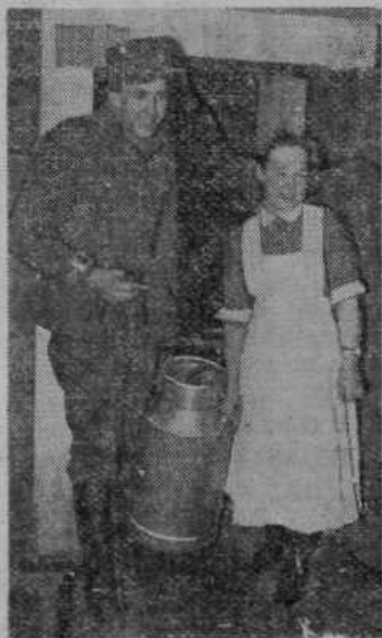
Finski vojak pomaga ženski pri prenašanju mleka