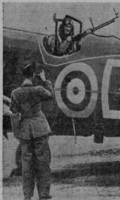
Francoski letalski častnik daje pred dvigom v zrak zadnja navodila strelcu pri strojnici v angleškem bombniku