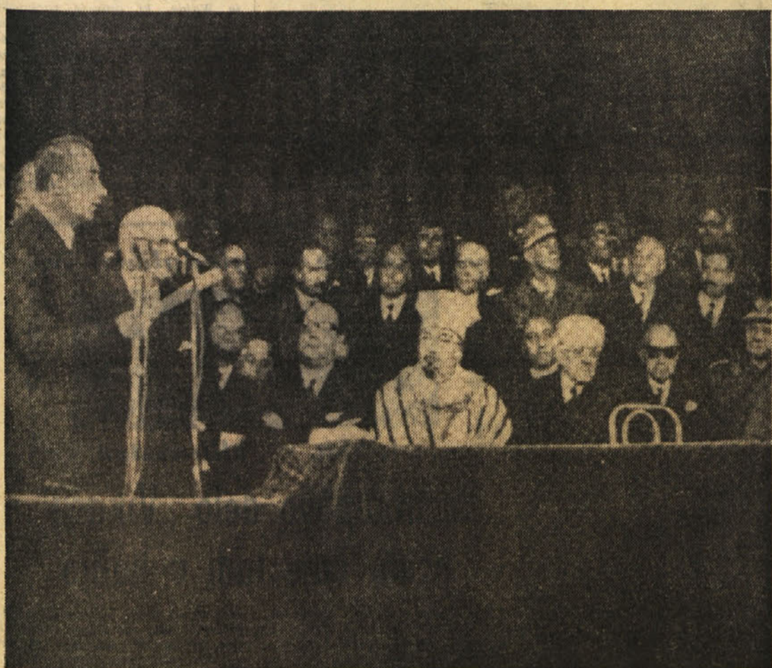
Predsednik vlade Moro govori na komemoraciji žrtev pokola v Fosse Ardeatine