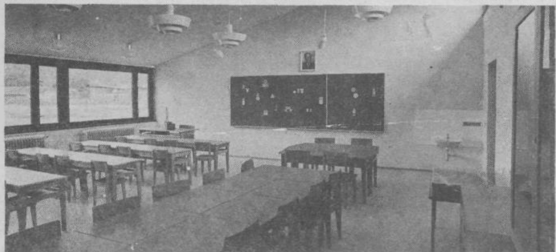
Notranji izgled nove osnovne šole v Zalogu. Prostori so funkcionalni, zračni, svetli in bodo šolarjem nudili ugodno počutje