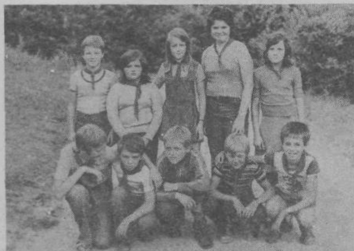
Skupina pionirjev iz naše občine na prelepih Plivskih jezerih pri Jajcu

Skopje, Tetovo, Gostivar, Kičevo, Debarca, Ohrid, Bitola, Prilep, Kavadarci, Strumica, Štip, Titov Veles in Kumanovo.