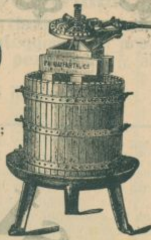
Torchio a mano.

MACINE da Uva e Frutta, Sgranatrici con unite Pigiatrici d'Uva, APPARATI ESSICATORI da Frutta ecc. PRESSE da FIENO, Paglia ecc. Sgranatori da Frumento, Ventilatori da Pulire Grano, Cernitori.