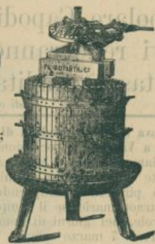
Torchio a mano.

MACINE da Uva e Frutta, Sgranatrici con unite Pigiatrici d'Uva, APPARATI ESSICATORI da Frutta ecc. PRESSE da FIENO, Paglia ecc. Sgranatori da Frumento, Ventilatori da Pulire Grano, Cernitori.