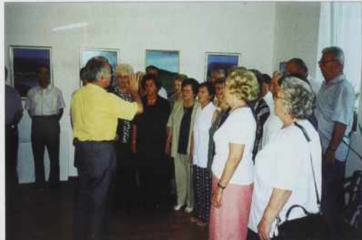
Zapel je Mešani pevski zbor Vladimir Močan.