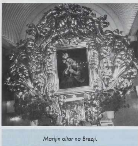
Marijin oltar na Brezji.