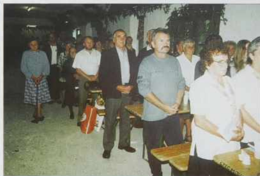
Pri meši je lepau vkūprišlo lūstvo.

ke edne vesi, gde lūstvo tak vkūper segne, če kaj trbej delati, enoma drugoma pomagati. Takšni so kak edna vólka familija, zgodi se, ka se malo kaj korijo, dapa gda trbej za delo prijeti, te se vōpokažejo.