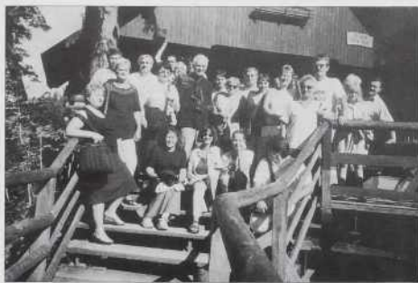
Naša skupina pri Vintgarju.

Bili smo na blejskom gradi tó. Od tec je najlepši razgled na jezero pa otok, gde stoji cerkev. Gda smo prišli dola z grada, so ranč zvonili v cerkvi sv. Martina, začnla se je večerna sveta meša. Je