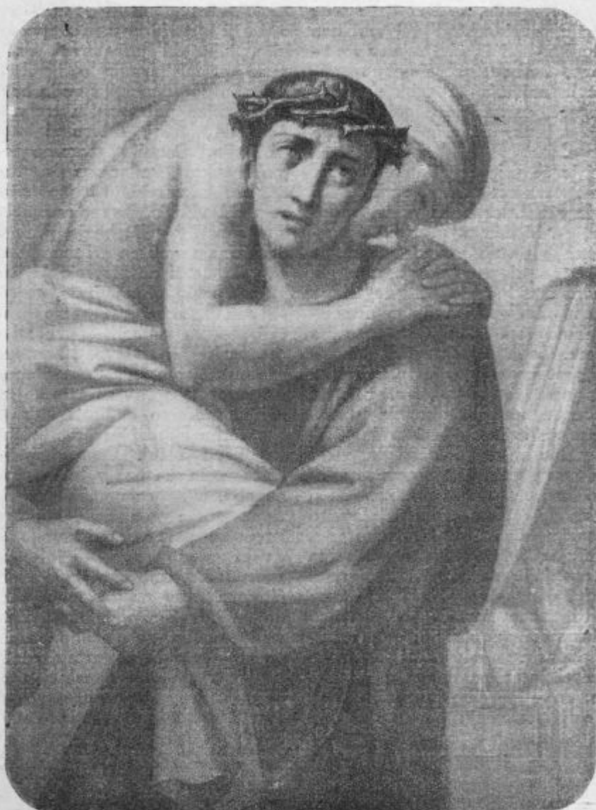
Sv. Janez od Boga (8. marca) — vzor krščanske dobrotelčnosti.

Sv. Ludovik, ponižni kralj francoski, je vsako soboto večjemu številu noge umival, jih brisal in poljubljal. Večkrat je siromakom pri mizi stregel. Vedno so jedli pri njegovi mizi stari revčki, ki jim je sari od svojih jedi delil. Tudi je v Parizu in