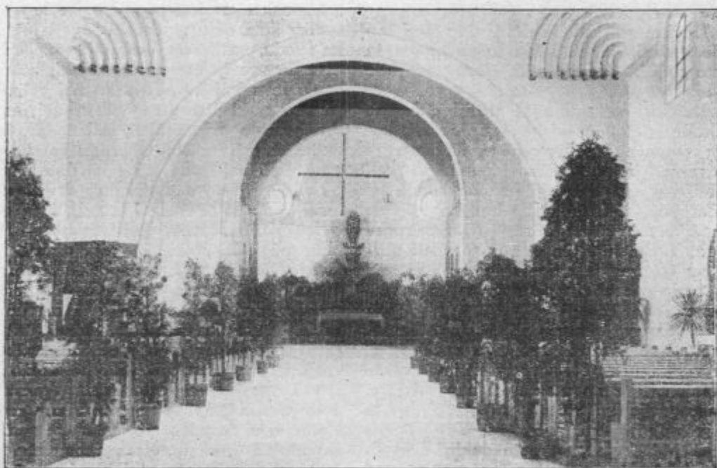
Cerkev sv. Jožefa v Ljubljani na dan posvetitve 19. marca 1922.

soseka ali večja vas eno). Naloga teh je prodajati Misijonski koledar, pobirati članarino za »Misijonsko mašno zvezo« in druge misijonske darove. Odsek je kupil v Jugoslovanski knjigovoznici 5 vezanih zapisnikov (435 K) po 100 listov. Zadostovalo bo vsaj za 20 let. Zapisniki so trdno vezani in imajo ob robu slovensko abecedo. Nabiralka ima v knjigi vse člane, jih lahko po abecedni razdelitvi hitro najde in tu ni treba drugega, kot dobljeni znesek vpisati v predalček za tisto leto. Ta način se je v Predosljih pri »Apostolstvu« sijajno obnesel.