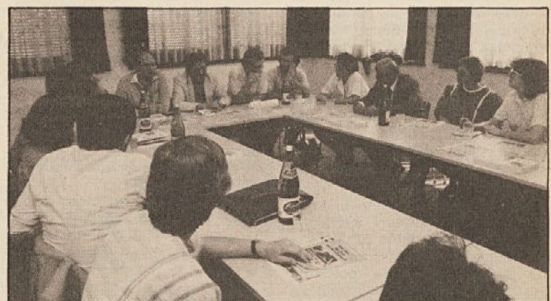
Včeraj, 14. maja, so šolniki iz graške okolici obiskali Koroško. Med drugim so se pogovarjali s predstavniki slovenskih osrednjih organizacij (slika — pri razgovoru v Slomškovem domu), zastopnikom hajmatdinstva in uradnicu deželne vlade. Obiskali so še Zadrugo v Globasnici in se srečali z občinskimi odborniki. Več o obisku šolnikov bomo poročali naslednjič.

Udeleženci so soglasno potrdili odgovornost obeh naših osrednjih političnih organizacij, ki naj tudi v tem vprašanju nastopata kot merodajni in edini zastopnik slovenske narodne skupnosti! (Resolucijo objavljamo na strani 6)