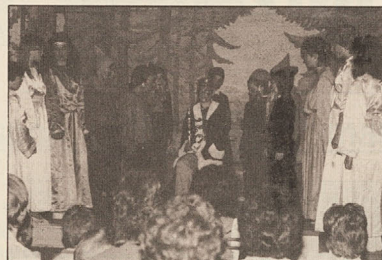
V Vogrčah so mladi zaigrali igro „Sirota Jerica“