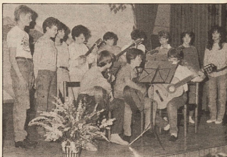
Skupina Popcorn je zaigrala in zapela

Slovenska gimnazija na obisku pri SPD „Srce“