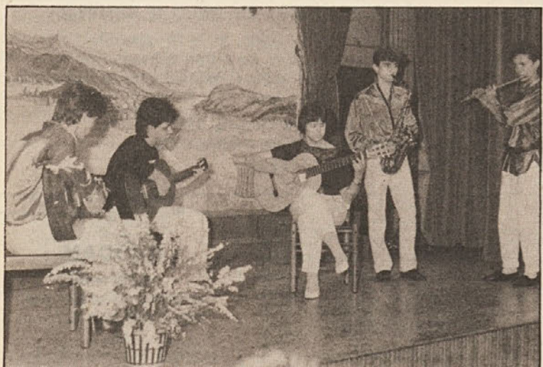
Skupina „Veritas“ je odlično zaigrala