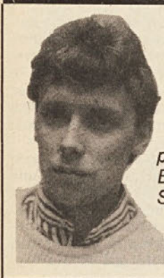
piše Bernardo Sadovnik