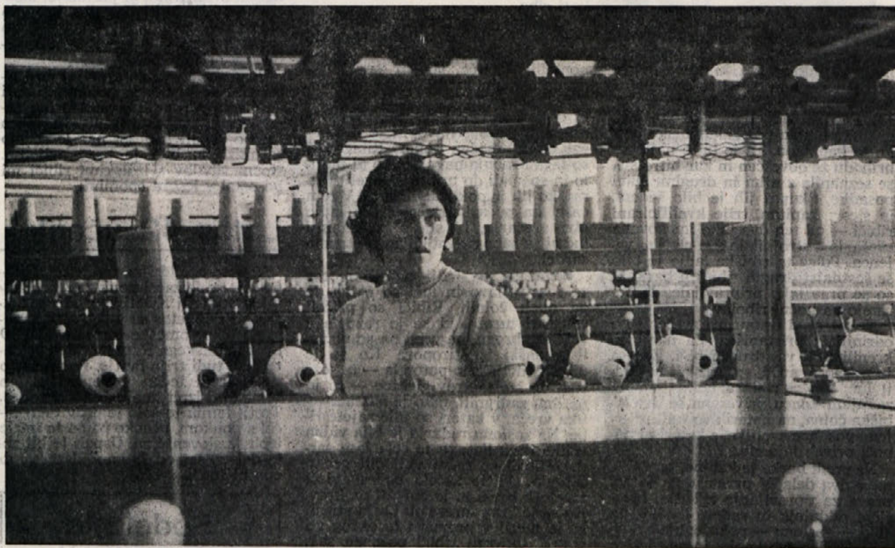
V proizvodnji je vrsta zapletenih procesov, vendar so jim tudi praktikanti kos, če se zavzamejo. Posnetek je iz metliškega obrata.