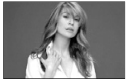
21.10 Nad.: Grey's Anatomy

6.30 I menù di Benedetta - Ricetta Sprint 7.40 16.10, 23.55 The Dr. Oz Show 8.30 12.55, 18.55 Dnevnik 8.50 12.00, 13.05 I menù di Benedetta 10.00 19.00 Talent show: Chef per un giorno 11.00 20.05 Cuochi e fiamme 14.05 16.50 SOS Tata