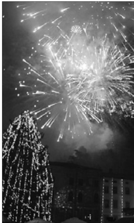
Lanski ognjemet v Gorici