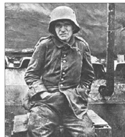
Ob naslovu: eno izmed mnogih vojaških pokopališč na fronti; zgoraj: vojna je za seboj pustila le obup

Združitev Države SHS je potekala pod taktirko Svetožarja Pribečevića in njegovega klana, ki je imel glavno besedo v hrvaško-srbski koaliciji v Zagrebu. Pribečević je imel stike s srbskim premierjem Nikolo Pašićem še pred vojno, sama združitev pa je potekala v veliki naglici, brez referendumov, brez parlamentarne privolitve ali volitev. Podobno kot Italijani so bili tudi Srbi pijani od zmagovalstva. Slovincem in Hrvatom so srbski