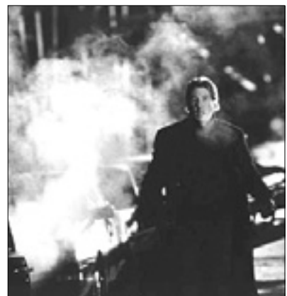
23.05 Film: The Mothman Prophecies - Voci dall'ombra (triler)

6.50 Serija: Zorro 7.10 Serija: Hunter 8.05 Nad.: Bandolera 9.30 Serija: Carabinieri 10.35 Sai cosa mangi? 10.45 Rubrika: Ricette all'italiana 11.30 18.55 Dnevnik, vreme in prometne informacije 12.00 Serija: Detective in corsia 13.00 Serija: La signora in giallo 14.00 Lo sportello di Forum 15.30 Serija: Hamburg distretto 21 16.35 Ieri e oggi in Tv 16.50 Film: Posta grossa a Dodge City (western) 19.35 20.45 Nad.: Tempesta d'amore 20.10 Nad.: Centovetriere 21.15 Nad.: Victor Ros