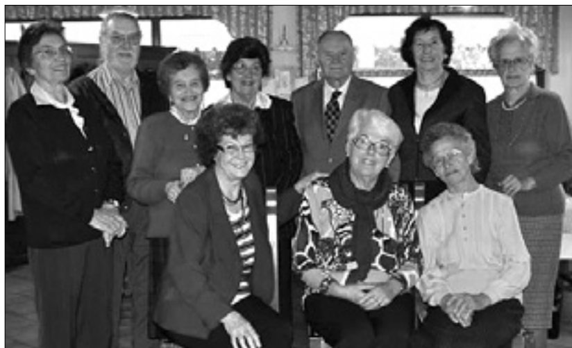
Maturantje danes in pred šestdesetimi leti

Srečanje so ponovili tudi letos, ob šestdeseti obletnici mature. Bivši sošolci so se zbrali ne več zato, da bi se učili zgodovino, latinščino ali zemljepis, temveč zato, da bi obujali spomine in spoznavali življenja sovrstnikov, s katerimi so v šolskih letih preživeli toliko prijetnih ur. (tp)