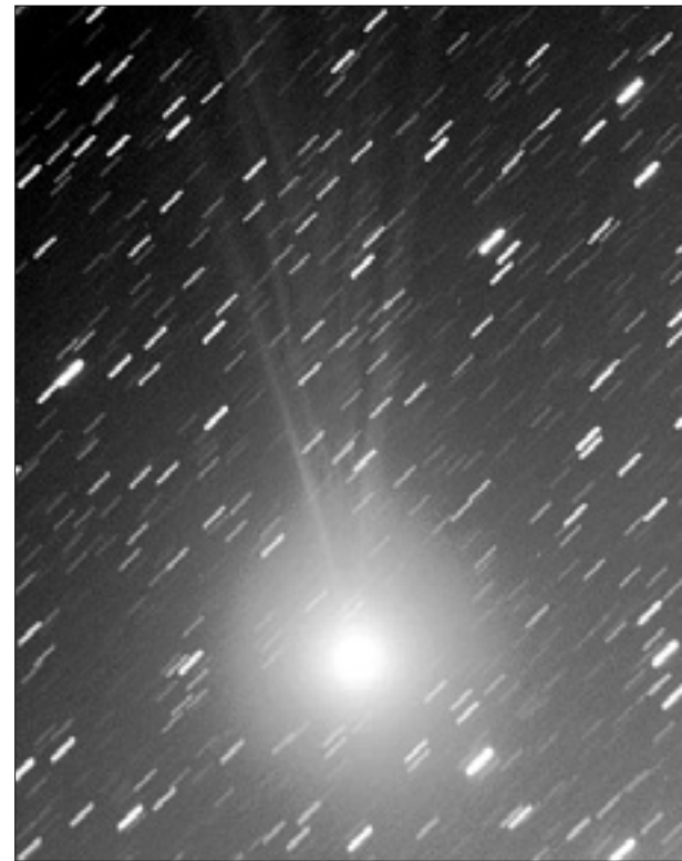
Komet Lovejoy so v Fari fotografirali v noči s petka na soboto

Tudi v naših krajih je že viden komet C/2014 Q2, ki so mu dali ime Lovejoy in nas spominja na zvezdo repatico. V zadnjih jasnih nočeh so ga prvič fotografirali in opazovali tudi astronomi, ki se zbirajo v observatoriju v Fari. Komet je trenutno 5,4 magnitude in ga brez večjega napora lahko opazujemo že z navadnim lovskim daljnogledom 10x50. Najlepše je viden okrog polnoči, ko je najvišje na nebu v ozvezdju Golob in se giba v smeri ozvezdja Zajec. Sicer pa vso lepoto kometa Lovejoy trenutno razkrivajo fotografije posnete iz južne zemeljske poloble. Tam je komet visoko na nebu in tako v veliko boljši legi za opazovanje kot pri nas. Čudovite barve in dinamično spreminjajoča se struktura repa dolžine do 5 stopinj ga uvrščajo med lepše komete zadnjega obdobja na našem nebu. Iz Fara pojasnjujejo, da se bodo januarja pogoji za opazovanje kometa izboljšali, saj bo veliko bolje viden tudi na severni polobli; ob lepem vremenu ga bo iz observatorija v Fari mogoče občudovati v četrtek, 8. januarja.