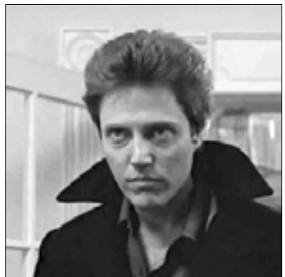
22.55 Film: La zona morta (horor)

11.35 15.40 La vita segreta di una teenager americana 12.25 18.00 Xena 13.05 Private Practice 13.55 20.20 Under The Dome 14.40 Web Series Collection 14.55 Greek 16.25 The Lost World 17.10 Novice 17.15 Streghe 18.45 Continuum 19.35 Stargate Atlantis 21.10 Film: Ip Man - Final Fight (akc.)