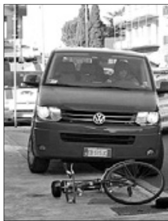
Prizorišče nesreče BONAVENTURA

TRŽIČ - V nesreči Po trčenju kolesar z glavo udaril v drog