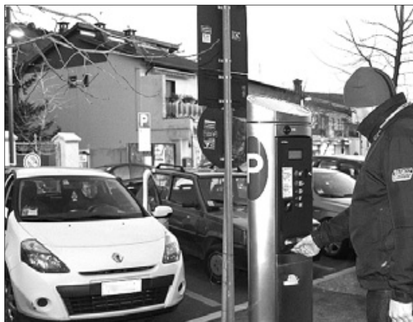
Levo plačevanje parkirnine na Gorici v Boljuncu, desno parkomat

Župan Klun je v odgovoru posredoval svetniku cel zanimivih kup podatkov. Nakup parkomata je stal 4.450 evrov (plus davek na dodano vrednost), namestitvev pa 100 evrov. Sredi marca je občinska uprava kupila 50 zvitkov termičnega papirja za izdajo parkirnih list-