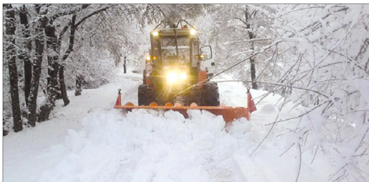
Sovoedenjski občinski delavci čistijo zasneženo cesto na Vrhu (zgoraj), včerajšnji sankaske užitki (spodaj)