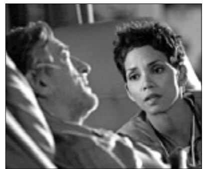
21.10 Film: Capodanno a New York (kom., '11, i. R. De Niro, A. Kutcher, H. Berry) 23.40 Heroes - Lo sport nel cuore

6.00 Pregled tiska 7.55 Dnevnik, prometne informacije, vreme, borza in denar 8.45 Serija: Un ciclone in famiglia 11.00 Aktualno: Forum 13.00 19.55 Dnevnik in vremenska napoved 13.40 Nad.: Beautiful 14.15 Film: Regali e segreti (kom.) 16.00 Nad.: Il segreto 17.00 Film: Qualcosa di magico (kom.) 18.45 Kviz: Avanti un altro! 20.40 Show: Striscia la notizia - La voce dell'indigenza