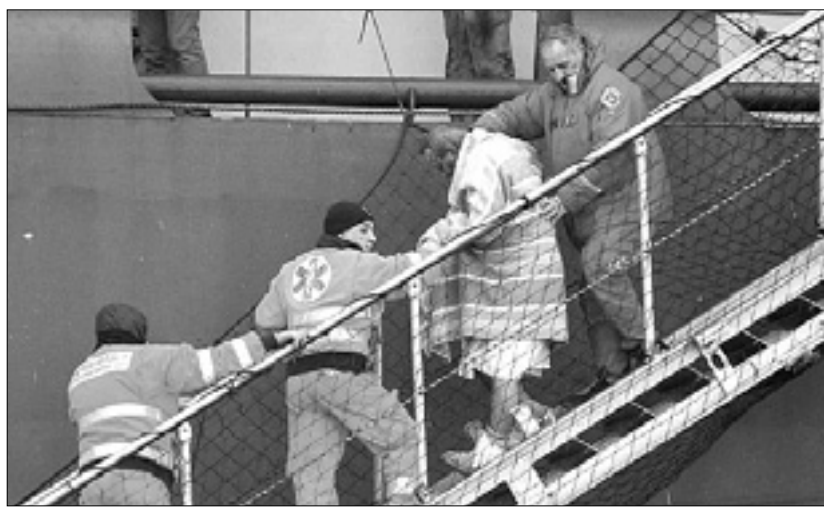
Rešene potnike so večinoma prepeljali v Bari

Reševanje z ladje je bilo sredi ekstremnih vremenskih razmer zelo zahtevno in dolgotrajno. Prestrašeni potniki in člani posadke so se sredi gostega dima večinoma zatekli na palubo, od koder so jih postopoma evakuirali na bližnja plovila, ki