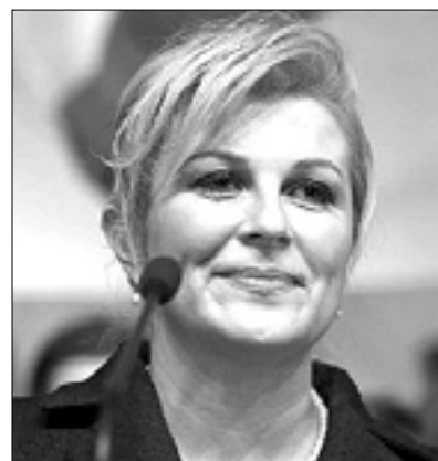
Kolinca Grabar Kitarović