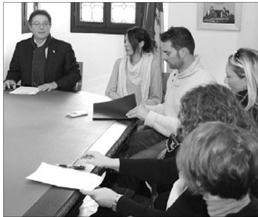
Srečanje o nakupovalnem središču Tiare

V Ulici IV Novembre v Trziču se je včeraj okrog 10.30 v prometni nesreči poškodoval 84-letni domačin E.F., ki je bil s svojim kolesom namenjen proti središču mesta. Moški se je ustavljal pred križiščem sredi Ulice IV Novembre, ker je bila na semaforju prižgana rdeča luč. Ko se je prižgala zelena, sta tako on kot avtomobil zapeljala naprej, ravno takrat pa je iz še nepojasnjenih razlogov prišlo do trčenja. Moški je izgubil ravnotežje, padel na tla in z glavo trčil v drog javne razsvetljave. Voznik je tako izstopil iz avtomobila, v katerem so bili še trije potniki, in klical na pomoč. Na kraj je prihitelo osebje službe 118, ki je kolesarja odpeljalo v tržiško bolnišnico. Moški se je s krmilom kolesa ranil v trebuh, poleg tega je utrpel močan udarec v glavo, njegovo življenje vsekakor ni ogroženo. Medtem ko so reševalci nudili prvo pomoč poškodovancu, so za urejanje prometa poskrbeli mestni redarji.