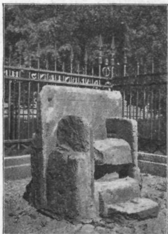
Vojvodski prestol na Gosposvetskem polju

Četrť ure pod vrhom Sv. Helene je vas Gorje. Otroci hodijo v šolo pol ure daleč v Otmanje. Gorje je že jako ponemčeno. Spodaj ležeče vasi so še bolj slovenske. Vprašal sem žensko srednjih let, kako da ljudje ne znajo več vsi slovenščine. Odgovorila je: »Pomrli so.« Slovenci tukaj dobesedno izumirajo. Stari umirajo, mladi pa ne znajo več slovenščine. Vprašal sem: »Zakaj pa otrok niste naučili slovenščine?« Dobil sem odgovor: »Niso se hoteli učiti.« Vprašal sem, kaj je vzrok, da se kraj tako hitro ponemčuje. Preprosta kmetiška žena mi je odgovorila: »Šola je nemška.«