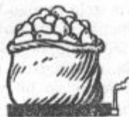
Krompir 890 kal.