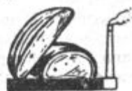
Kruh 2400 kal.