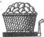
Jajce 1560 kal.